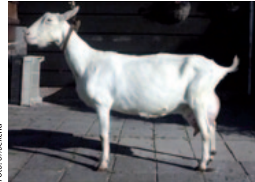
Maisy 37 (AV90, KS*) staat met 15 jaar nog best op de benen (op de foto is ze 11,5).