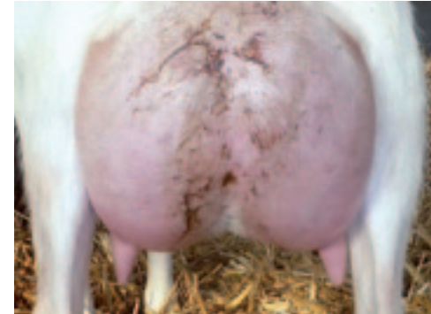
Bildthoekster Maysi 67 kreeg als jaarling 89 punten voor haar uier.