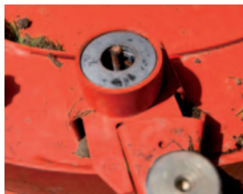
Vervangingsonderdelen voor de overbelastingsbeveiliging, heb je altijd bij de hand.