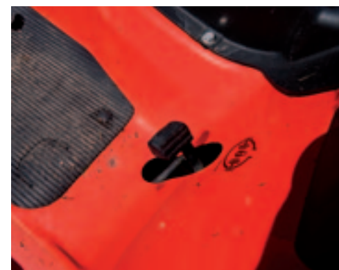
Vierwielaandrijving is niet leverbaar op de G26. Wel is er een differentieelslot.