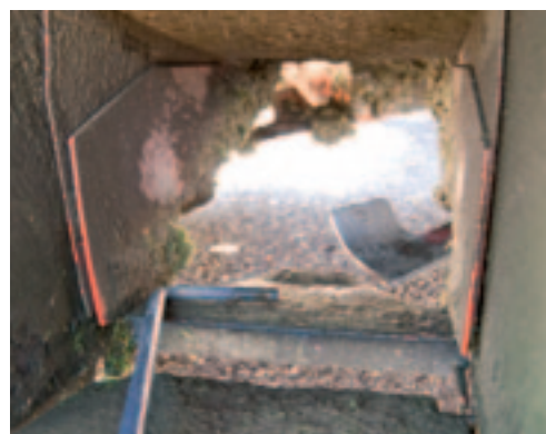
Het voorste deel van de bodemplaat moet je met de hand schoonmaken als nat gras aankomt.