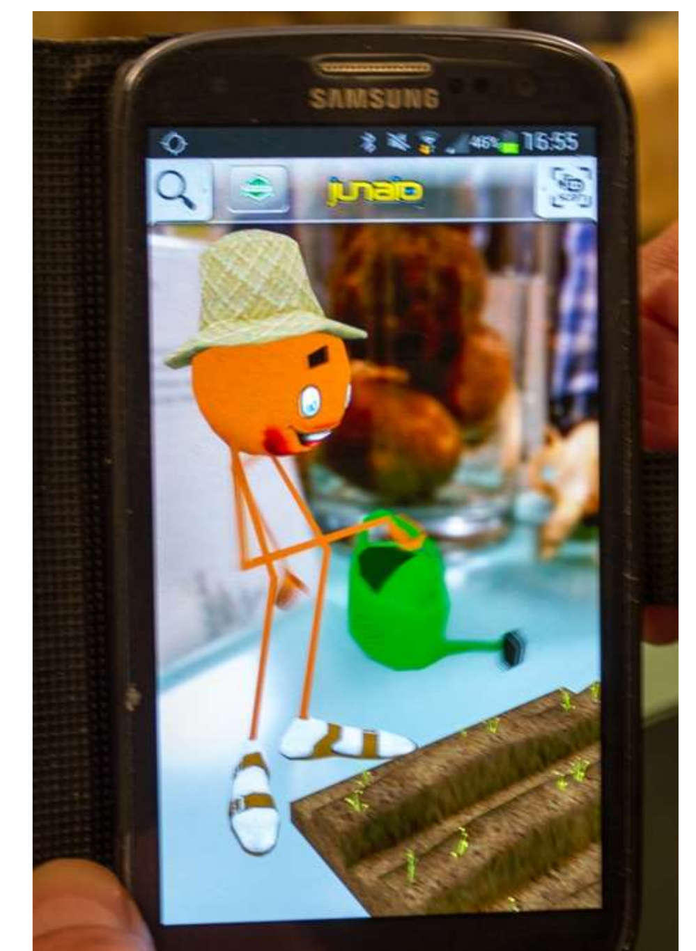
Figuur 3. Augmented reality op tablet of smartphone bij (uw?) eindproducten en close up.