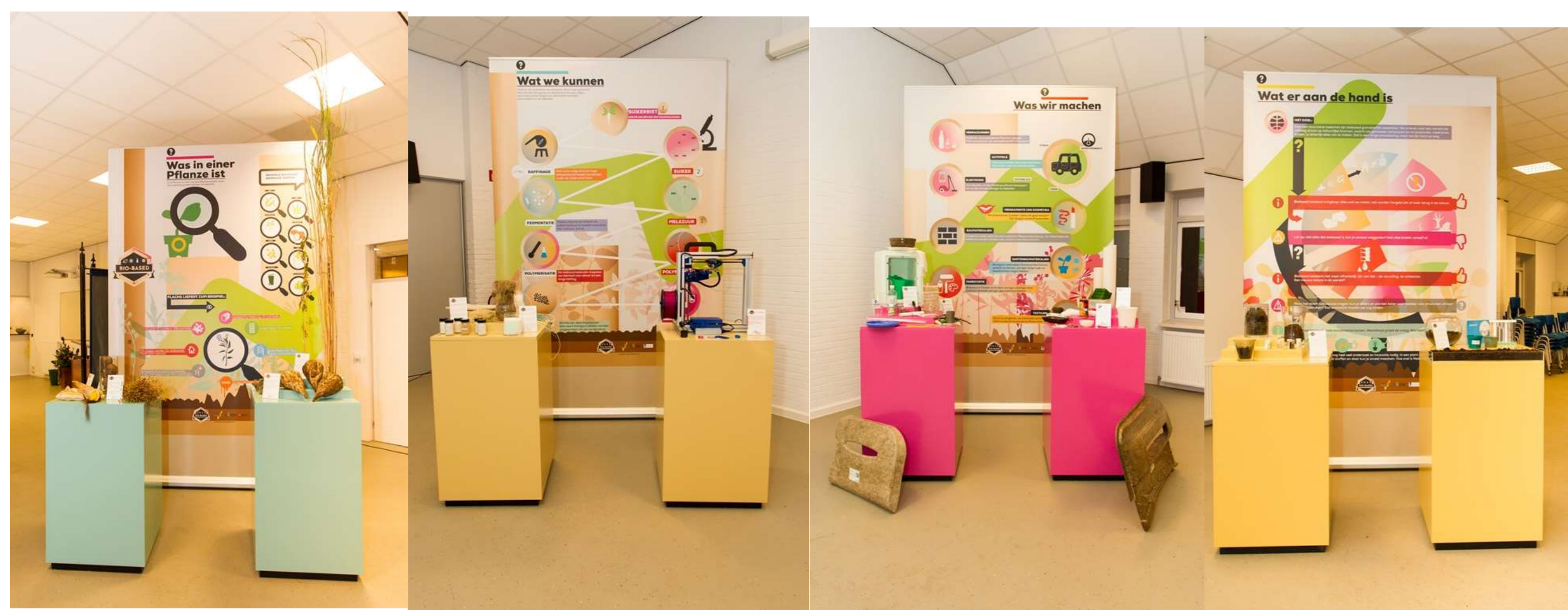
Figuur 2. Grondstoffen, raffinage, eindproducten en kringloop weergegeven met banners en counters met producten.