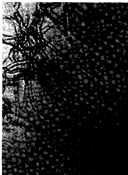
FIG. 2. Dunne hyfen en kettingen van donkerder gekleurde kortere cellen, 150 ×.

Thin hyphae and chains of darker coloured closely septate cells, × 150.