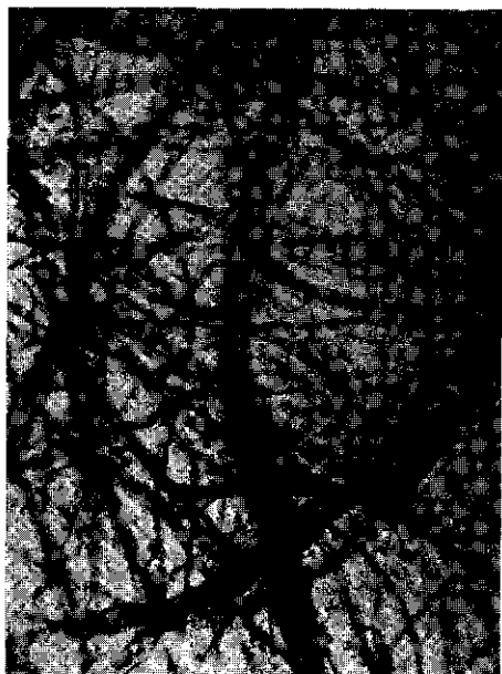
FIG. 1. Koorden van dicht opeengepakte hyfen, 150 ×.