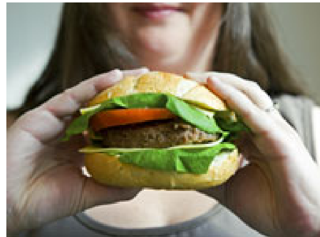
Zes kinderen zijn ziek geworden van het eten van een verkeerde hamburger

De bacterie waar de kinderen ziek van zijn geworden, is niet verwant aan de EHEC-bacterie die 38 Duitsers de afgelopen weken het leven kostte. De EHEC is wel een variant van E. Coli, die voluit Escherichia coli heet.