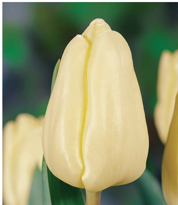
Tabel 10 a.

Broeierijresultaten per cultivar van zift 12-op van de bollen afkomstig van klei en zand. Deze werden gebroeid op potgrond (10a) en op water (tabel 10b) in de derde week van februari.