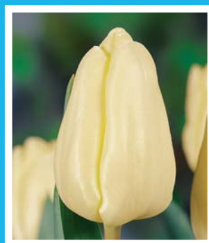
FUN FOR TWO