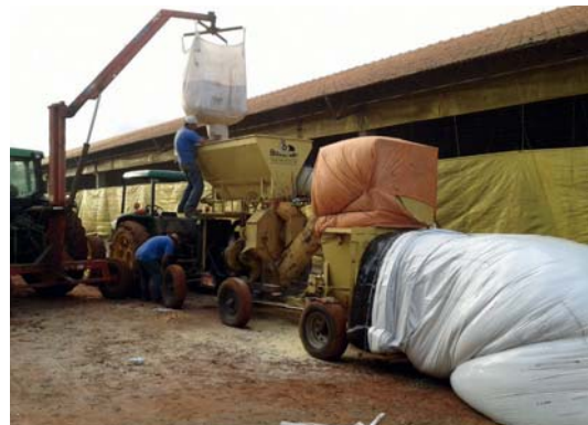
Naast zijn twee varkensbedrijven heeft Borg nog 1.050 hectare akkerbouw.