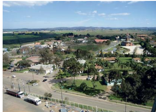
Castrolanda is een Nederlandse kolonie met 800 inwoners en een landbouwcoöperatie.