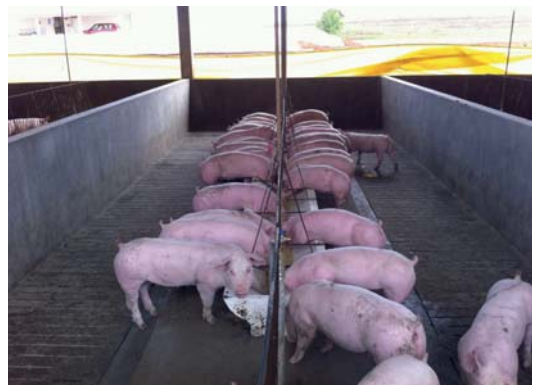
Op zijn ene varkensbedrijf krijgen de dieren droogvoer en bij het andere brijvoer.