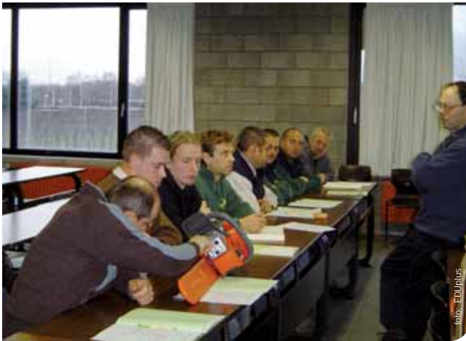
▲ EDUplus heeft opleidingen ontwikkeld die niet alleen aan de werking van de machine aandacht besteden maar ook het aspect veiligheid uitgebreid belichten

De EDUplus-opleidingen bieden werknemers de mogelijkheid tot het gratis behalen van vereiste attesten zoals EHBO, VCA basis, VCA leidinggevenden, heftruck, hoogwerker, verreiker, elektrische transpallet, graafmachines, BA 4... Na deze opleiding beschikken de arbeiders niet alleen over een geldig attest maar kunnen zij vooral op een verantwoorde manier hun job uitoefenen.