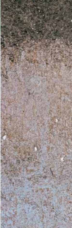
Poldervaaggrond van zeeklei (student)