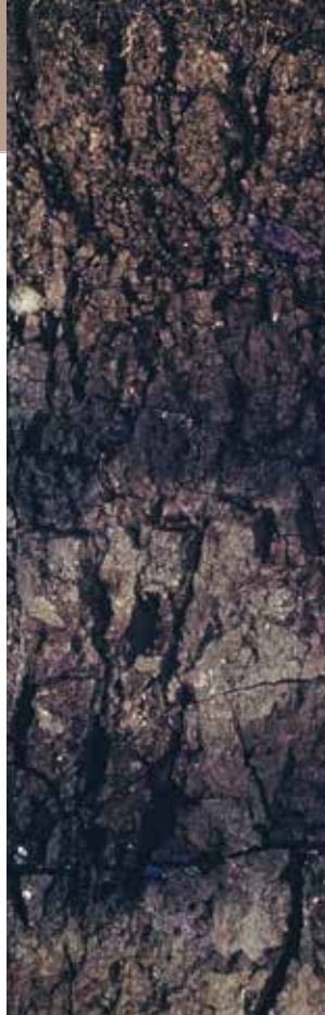
Poldervaaggrond van rivierklei (VUT-ter)

Een voorbeeld van een grond met de VUT is een kalkloze jonge rivierklei in het Land van Maas en Waal (een Poldervaaggrond; 7% O.S., 0% kalk). Deze grond heeft veel organische stof, maar geen kalkvoorraad in de bouwvoor. Het percentage organische stof is zo hoog opgelopen, omdat de mineralisatie sterk is afgenomen. Het bodemleven heeft het minder naar de zin. Er is dus wel veel oude bodemvruchtbaarheid in opgeslagen, maar deze komt niet makkelijk meer in beweging. Bij zorgvuldig beheer is deze grond nog te gebruiken voor landbouw, bijvoorbeeld als grasland. Het herstelvermogen is echter niet groot, dus zware bodembewerking en de teelt van rooivruchten of maïs is slecht voor deze bodem. Je kunt de kwetsbare structuur die in de toplaag door graswortels en organische stof is ontstaan, makkelijk verstoren. Herstel gaat dan veel trager dan in jongere ontwikkelingsstadia. De eik is een boom die van nature op deze grond past. De eik is een grillig groeiende, knoestige boom, die zich goed aanpast aan de grove structuur in de bodem.