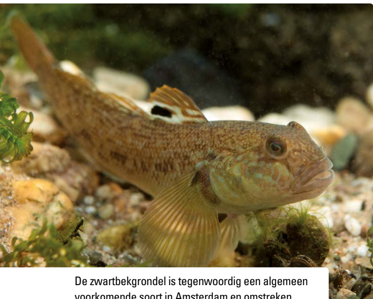
De zwartbekgrondel is tegenwoordig een algemeen voorkomende soort in Amsterdam en omstreken.

Ruijter haalt een fuik vol kwallen binnen: de doorzichtige beestjes fonkelen in het ochtendlicht. Hij stopt ze voor ons in het glazen bakje zodat we ze goed kunnen bekijken. Nu pas zijn de doorzichtige beestjes duidelijk te herkennen als kleine kwallen.