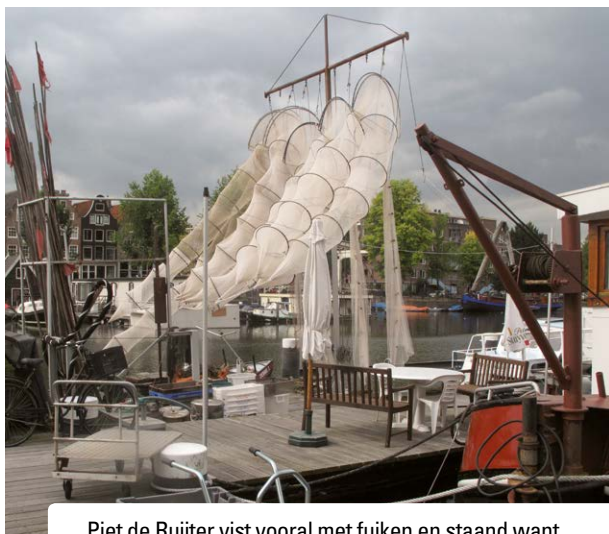
Piet de Ruijter vist vooral met fuiken en staand want.