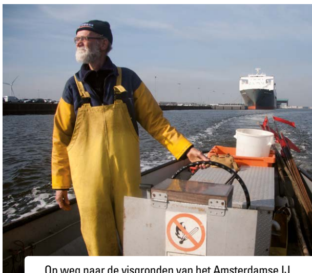
Op weg naar de visgronden van het Amsterdamse IJ.