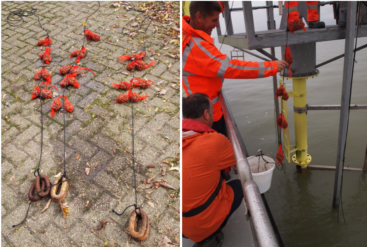
Figuur 2. Voorbeelden van het uithangen van de mosselen. Bevestiging van de mosselen aan het koord (links) met schakels als gewichten, uithangen van een koord aan een meetpaal met een cementanker om het koord strak te houden (rechts).

Per locatie zijn ongeveer 15 netjes met quaggamosselen uitgehangen, wat neerkomt op 4,5 kg bruto. De netjes met quaggamosselen zijn in week 39 (2013) op de diverse locaties uitgehangen. Deze najaarsperiode is bewust gekozen, omdat de spawningsperiode (productie en afzetten van ei- en zaadcellen: gametogenese) dan is afgelopen en de overlast (storm, ijsgang) van herfst en winter nog gering is. De netjes zijn in week 45 weer opgehaald. De accumulatie duur in dagen is weergegeven in bijlage 1.