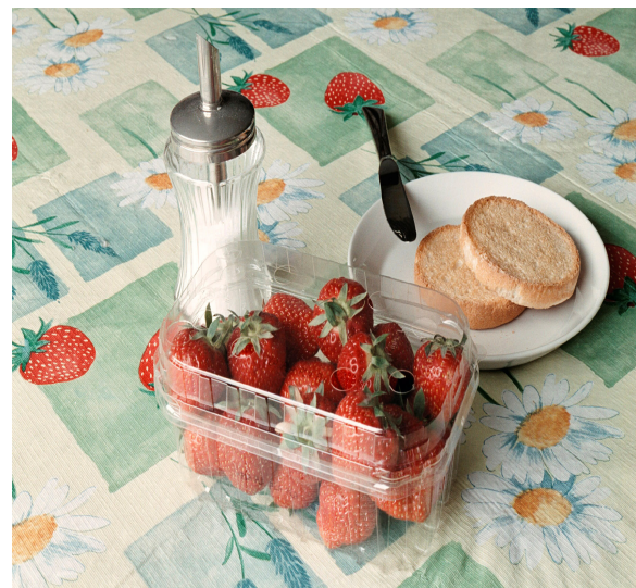
Aardbeienbakje voor biologische aardbeien, gemaakt van polymelkzuur.

www.european-bioplastics.org www.biopolymer.net www.natureworkslc.com www.sidaplax.com