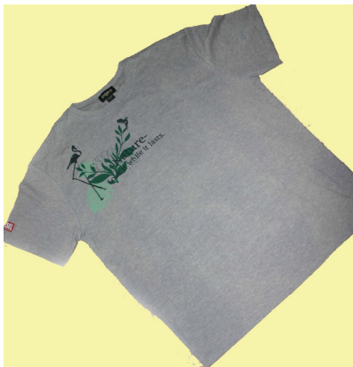
Een t-shirt van PLA-vezels

PLA kan door middel van (sheet)extrusie worden geëxtrudeerd tot folie. Uit deze folies kunnen vervolgens met dieptrekken vormdelen gevormd worden (thermoforming). Dunne films voor de productie van bijvoorbeeld zakken kunnen worden gemaakt via folieblazen. Van PLA kan verder, net als bijvoorbeeld van PET, een fles worden geblazen. Het materiaal kan ook worden geschuimd. Daarnaast kan PLA goed worden verwerkt tot vezels (wovens en non-wovens). De huidige productie-capaciteit van polymelkzuur is ongeveer 140 kton per jaar, de prijs van het granulaat is circa 1,5 à 2,5 €/kg.