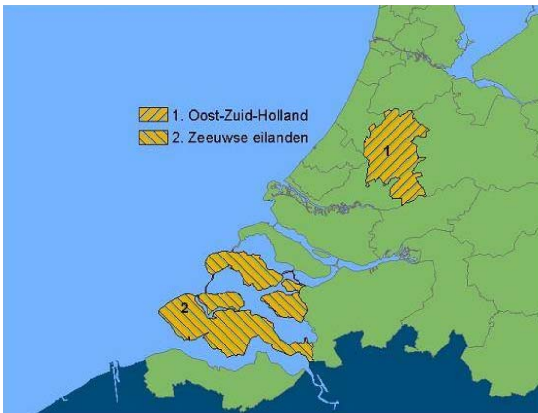
Figuur 1.1 De studiegebieden Oost-Zuid-Holland en de Zeeuwse Eilanden

Dit boekje laat de belangrijkste resultaten van het onderzoek in de Nederlandse studiegebieden zien. In hoofdstuk 2 en 3 komen de resultaten van respectievelijk Oost-Zuid-Holland en de Zeeuwse Eilanden aan de orde. Hoofdstuk 4 geeft conclusies en aanbevelingen voor het opbouwen van nieuwe stad-landrelaties in de Nederlandse studiegebieden en gaat in op de gezamenlijke aanbevelingen van het RURBAN-project.