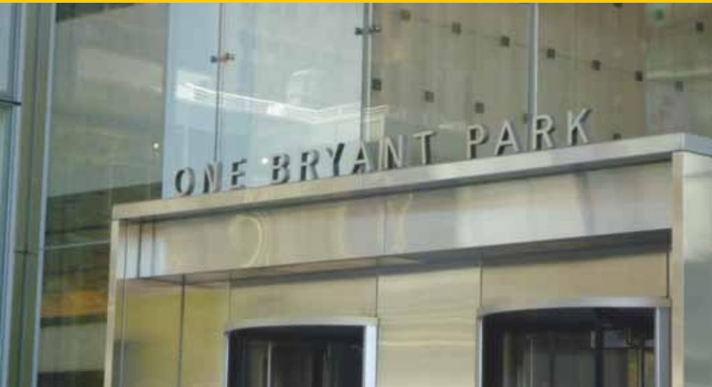
Deze bank verlangde slechts één tegenprestatie voor het subsidiëren van het Bryant Park in New York: hun adres moest voortaan zijn one Bryant Park.