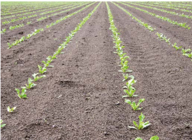
Een vroeg gezaaid gewas heeft al een betere weerstand tegen bijvoorbeeld rhizoctonia en bietencystealtjes op het moment dat deze zich later in het seizoen ontwikkelen

Wanneer kunnen de suikerbieten gezaaid worden? Soms een moeilijke beslissing. Voorwaarde is dat de grond voldoende opgedroogd is en dan zo snel mogelijk beginnen. Maar ook de weersverwachting speelt mee: blijft het droog en wat doet de temperatuur?