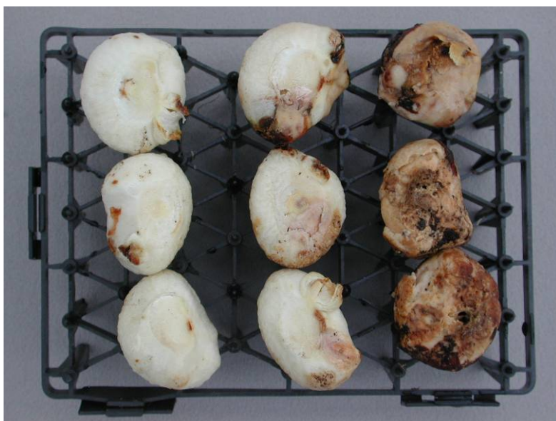
Figuur 12 Fusariumaantasting van de bol. Links gezond, midden licht aantasting van de bol door Fusarium, rechts zware aantasting