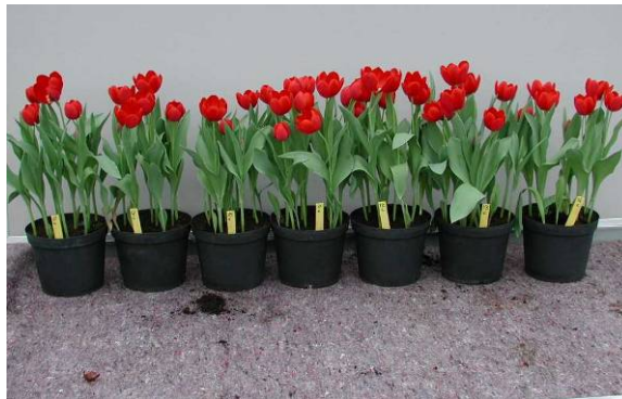
Figuur 6 Bloeieresultaat na een ontsmetting voor het planten in water (links) en 0.5% Formaline (rechts) in 30 opeenvolgende baden. (afgebeeld zijn de bloeiende bollen van bad 1, 5, 10, 15, 20, 25 en 30)