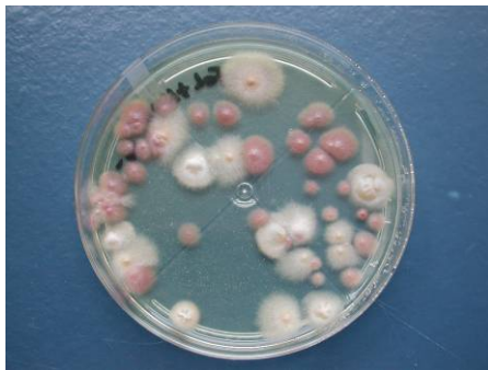
Figuur 3 Fusariumsporen op voedingsbodem als losliggende koloniën (llk)