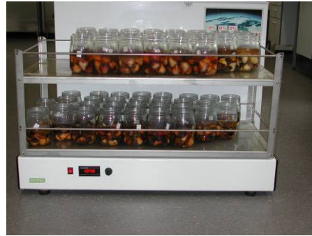
Figuur 2 Schudmachine voor schudden van bolmonster