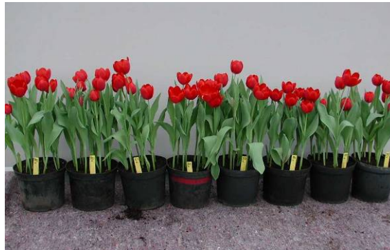
Figuur 7 Bloeieresultaat na een ontsmetting voor het planten in 0.5 % Jet 5 (links) en 0.3% 99 - 01(rechts) in 30 opeenvolgende baden. (afgebeeld zijn de bloeiende bollen van bad 1, 5, 10, 15, 20, 25 en 30)