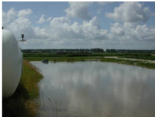
Figuur 10 Spoelbassin voor hergebruik van spoelwater