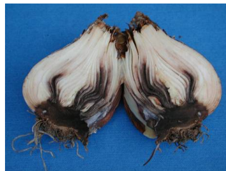
Figuur 14 Bolrot in narcis bij dwarsdoorsnede