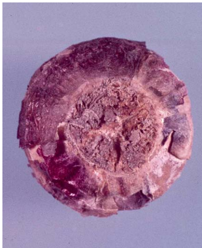
Figuur 15 Fusariumsymptoom krasbodem in hyacint