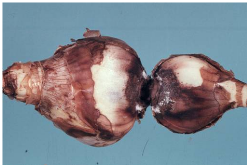
Figuur 13 Bolrot in narcis.

Narcisbollen worden na de oogst behandeld met warmwater voor bestrijding van nematoden (het zogenaamde 'koken' van de bollen). Voor activering van de nematoden en daardoor een betere bestrijding van de nematoden worden de bollen voorafgaand aan de wwv veelal voorgeweekt in water. De totale behandeling van de bollen bestaat dan uit: enkele uren voorweken van de bollen in koud water gevolgd door een warmwaterbehandeling van 2 uur 43,5 °C tot 47°C. Tijdens het voorweken en tijdens de warmwaterbehandeling kunnen gezonde bollen besmet raken met Fusariumsporen, afkomstig van bollen die al waren aangetast door de Fusariumschimmel, met als gevolg een nieuwe uitbarsting van bolrot en/ of huidziek (figuur 13 en 14).