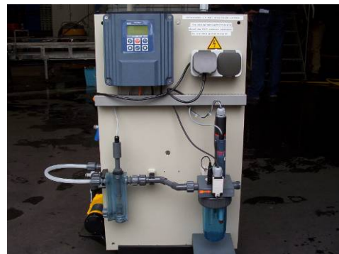
Figuur 4 Links de RQ flexmeter met meetstrookjes voor handmatige metingen en rechts de Prominent – Verder continue meet – en doseerapparatuur voor metingen van de concentratie van Jet 5.