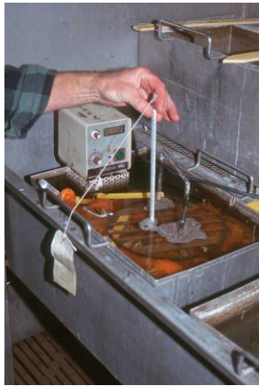
Figuur 1 Uitvoering van de warmwaterbehandeling