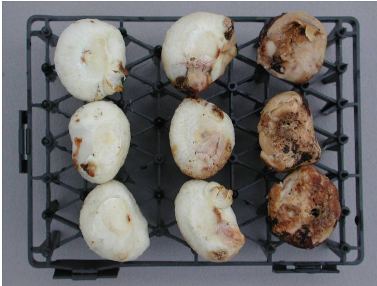
Figuur 12 Fusariumaantasting van de bol. Links gezond, midden licht aantasting van de bol door Fusarium, rechts zware aantasting