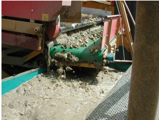
Figuur 9 Spoelen van tulpenbollen.