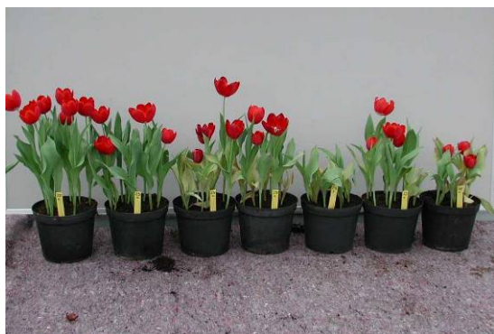
Figuur 8 Bloeieresultaat na een ontsmetting voor het planten in BC1000 in 30 opeenvolgende baden. (afgebeeld zijn de bloeiende bollen van bad 1, 5, 10, 15, 20, 25 en 30)