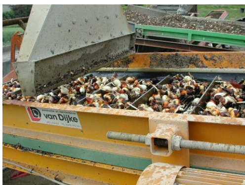
Figuur 11 Afblazen van bollen op de spoellijn om overtollig vocht snel af te voeren.

Op bedrijf 2 werden bollen van de cultivar 'Viking' gebruikt. Ook van dit bedrijf werden de bollen gespoeld in een spoellijn maar na het afblazen werden de bollen direct in de spoellijn gedurende 20 seconden ontsmet en vervolgens verzameld in kuubskisten en gedroogd.