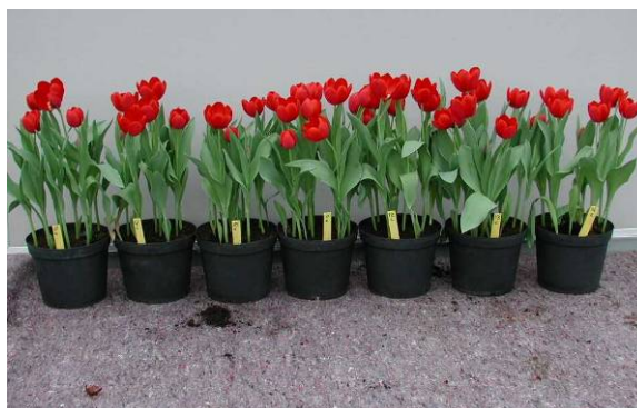
Figuur 6 Bloeieresultaat na een ontsmetting voor het planten in water (links) en 0.5% Formaline (rechts) in 30 opeenvolgende baden. (afgebeeld zijn de bloeiende bollen van bad 1, 5, 10, 15, 20, 25 en 30)