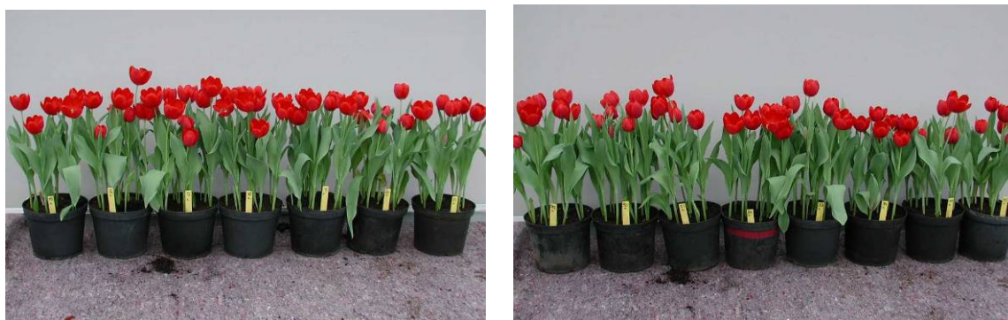
Figuur 7 Bloeieresultaat na een ontsmetting voor het planten in 0.5 % Jet 5 (links) en 0.3% 99 - 01(rechts) in 30 opeenvolgende baden. (afgebeeld zijn de bloeiende bollen van bad 1, 5, 10, 15, 20, 25 en 30)