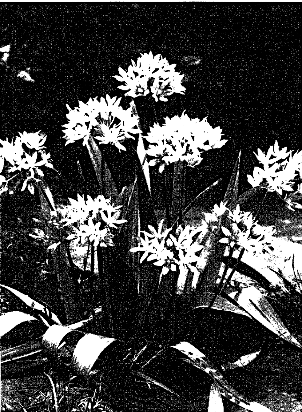
De meeste Allium soorten verlangen een zonnige standplaats. Allium moly met gele bloempjes is daarentegen in groepen onder bodem en struiken toe te passen

Het sortiment Allium biedt volop mogelijkheden voor toepassing; reden om de soortjes te proberen. Wat betreft de bloeitijd kunnen we de soorten onderscheiden in voorjaars- en zomer/herfstbloeiërs. De laatstgenoemde soorten moeten in het voorjaar worden geplant.