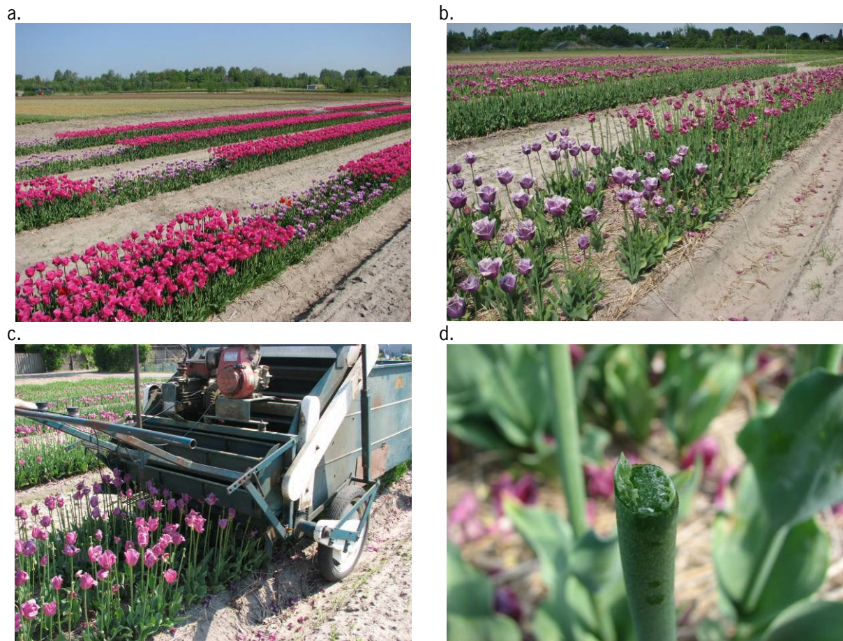
Figuur 2. Impressies van mechanisch kappen van tulp. (a) Proefveld voor onderzoek naar mechanische verspreiding TVX via de kopmachine (zie ook Figuur 1). (b) Proefveld op 13 mei 2008, de dag waarop het gewas machinaal is gekopt. Op de voorgrond de TVX-geïnfecteerde tulpen (cv. Blue Herron), op de achtergrond de virusvrije tulpen (cv. Barcelona). (c) Machinaal kappen met een handgestuurde kopmachine. (d) Een afgesneden bloemsteel met wondweefsel waarop de virusinfectie plaats kan vinden.