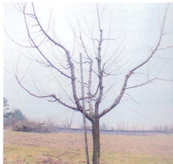
Links ongesnoeide boom, rechts goed uitgedunde boom.