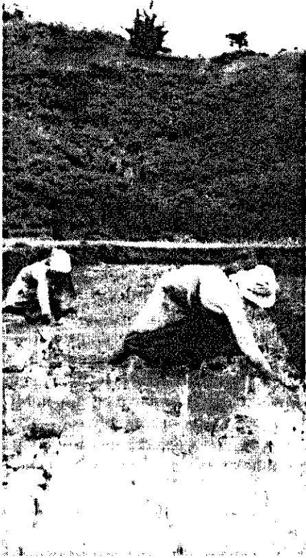
Bijna overal in de derde wereld zijn vrouwen verantwoordelijk voor de oogst.

volgende accentverschillen worden gelegd: