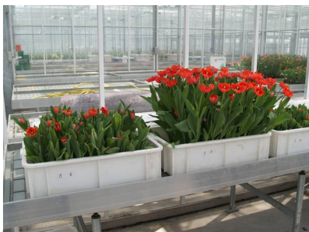
Foto 10. Gewasverschillen tijdens de tweede ontsmettingsproef. Links: besmet + peroxide, rechts: onbehandeld. Geheel rechts: besmet + fungicide.

De hoge besmetting had een sterk effect op de gewasgroei. Ook nu weer waren de beelden aan de wortels gering vergeleken met de groeiemming aan het gewas daarbij. Op foto 10 en 11 zijn hiervan enkele voorbeelden te zien.