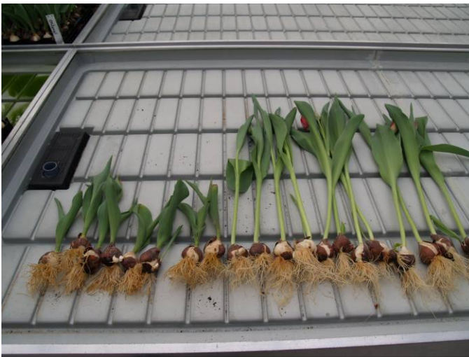
Foto 2. Planten van besmette eb/vloed-tafel links en rechts van onbesmette tafel. Er zijn verschillen in plantlengte en wortelverkleuring (aantasting) zichtbaar.

De tweede zet werd ingehaald op 6 maart. Omdat deze tulpen met hetzelfde water werden gevoed als de eerste zet was er bij de tweede zet besmetting aanwezig vanaf het moment van inhalen. Bij deze zet was direct vanaf inhalen een groeiremming merkbaar van de tulpen op de besmette tafels. Er was daarbij geen verschil tussen planten die wel of niet tevoren waren ontsmet van zowel de besmette tafels als de onbesmette tafels.