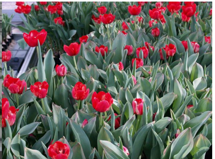
Foto 3. Beeld van geïnfecteerde tulpen rond het bloeitijdstip. Het gewas is ongelijk van lengte en de bloemen ongelijk in rijpheid. Ook zijn bloemverkleuringen zichtbaar.

De aantasting van de wortels had desastreuze gevolgen voor het gewas. Van de tafels met besmetting konden geen normale bloemen worden geoogst, terwijl op de onbesmette tafels een goede kwaliteit bloemen werd geproduceerd. Op de foto's 2 tot en met 5 zijn hiervan voorbeelden en details te zien. Aan het eind van de tweede zet is van het water een monster genomen en zijn de aanwezige pathogenen gedetermineerd met behulp van een DNA-scan. Hierin werd Fusarium oxysporum in een matige infectiegraad en Fusarium spp. in een zware infectie aangetoond. De toegediende Pythium - en Trichoderma -besmetting kon niet meer worden aangetoond. Er werden in de watermonsters geen plantpathogene bacteriën aangetoond.