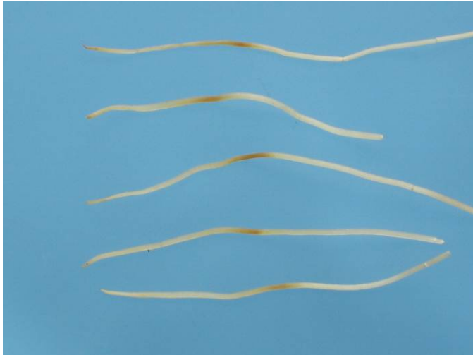
Foto 4. Beelden van de wortelaantasting. Het worteluiteinde (links) verkleurt grauwwit door de aantasting in het midden.