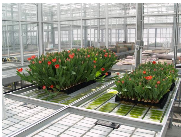
Foto 11. Opname van gewasverschillen op de eb/vloed tafels tussen onbesmet (links) en besmet zonder middelen (rechts).