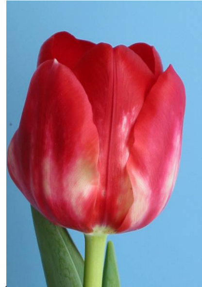
Foto 5. Bloemverkleuringen van de aangetaste planten.