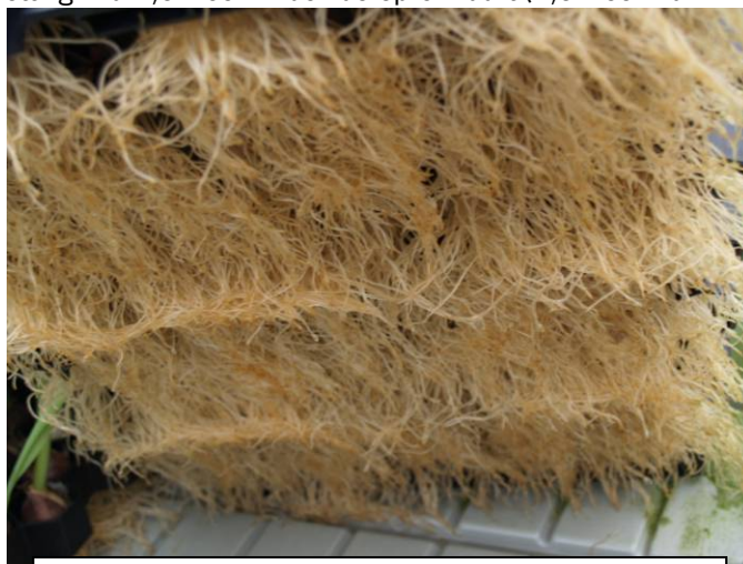
Foto 1. Het wortelgestel op de besmette tafels is goed ontwikkeld, maar vertoont een lichte beige verkleuring plus enkele aangetaste wortels.

Op 9 maart was het gewas op de besmette tafels niet meer verder gegroeid sinds de eerste symptomen. Het gewas op de onbesmette tafels groeide door en was ca. 10 cm langer. Het besmette gewas was erg ongelijk van lengte. De bloemknoppen vertoonden inmiddels kleur. De plantreactie was