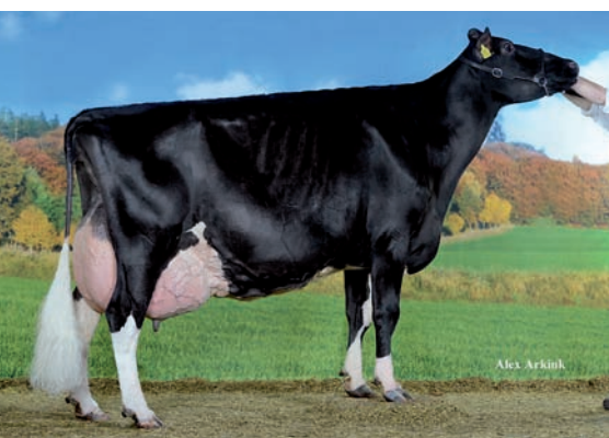
Wilhelmina 401 (v. James) dagkampioene en kampioene oudere koeien Prod.: 7.02 641 28.112 4,12 3,75 lw 140