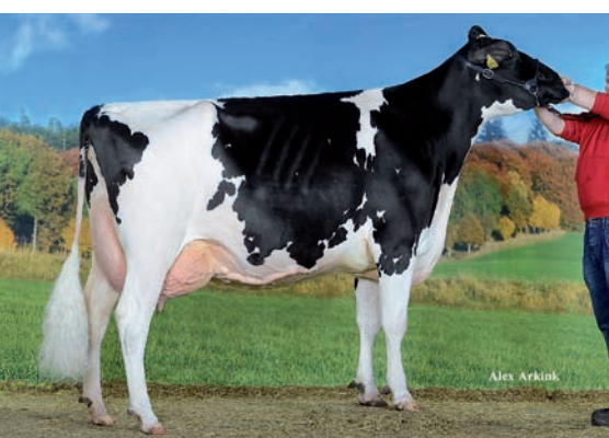
HBC Goldwyn Daydream (v. Goldwyn), kampioene middenklasse Prod.: 2.02 655 16.691 4,45 3,51 lw 116