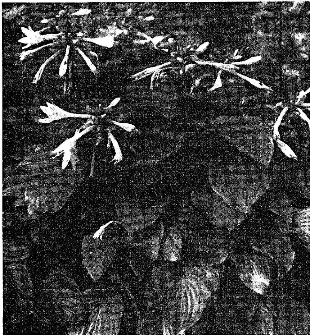
Hosta plantaginea 'Grandiflora'