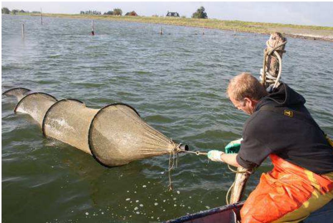
60 mm pijp in uiteinde van hokfuiik.