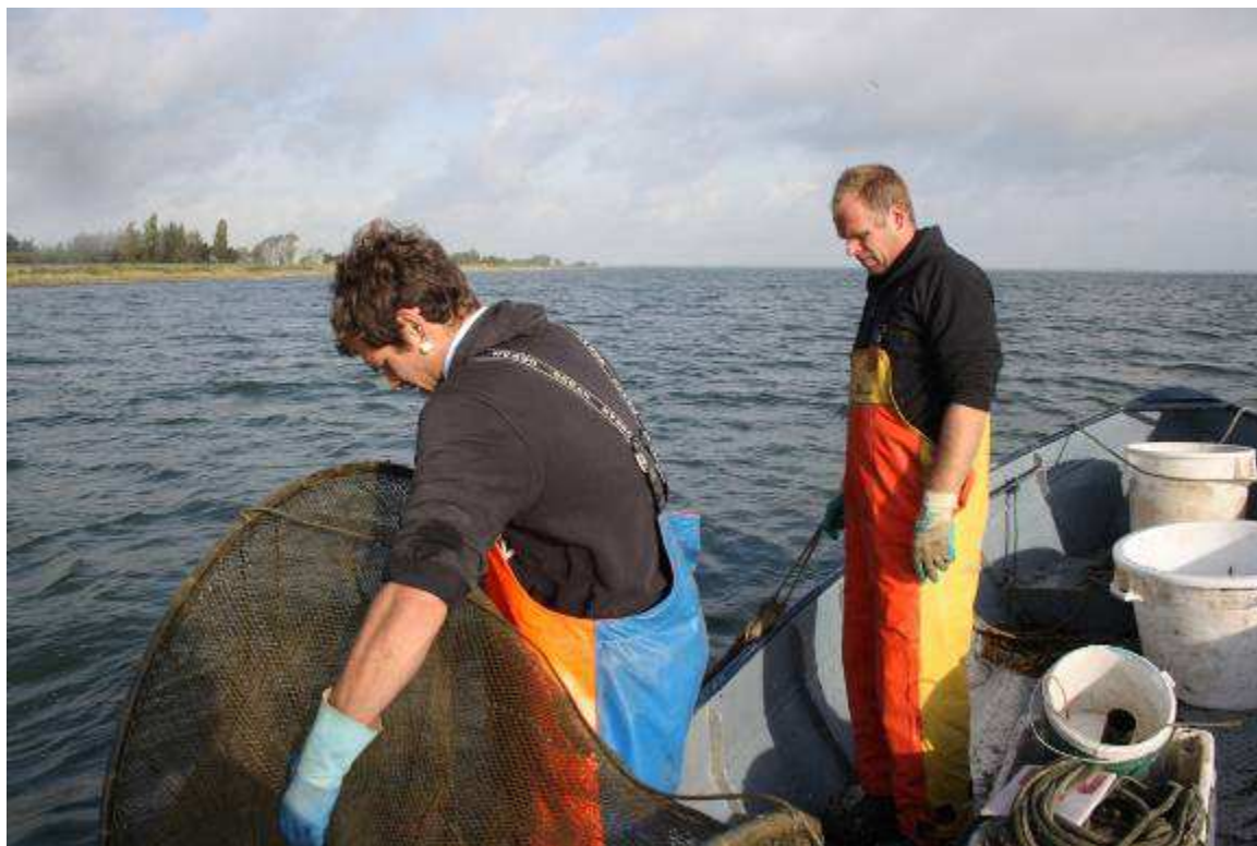
Schilder/Smit schietfuike op het IJsselmeer Noord-West kant