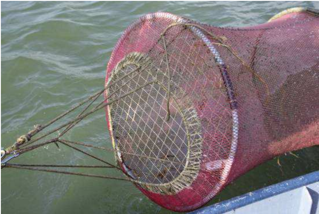
60 mm ontsnappingsruif. Ruif heeft eigen bevestigingstouwen aan hoofd(trek)lijn.