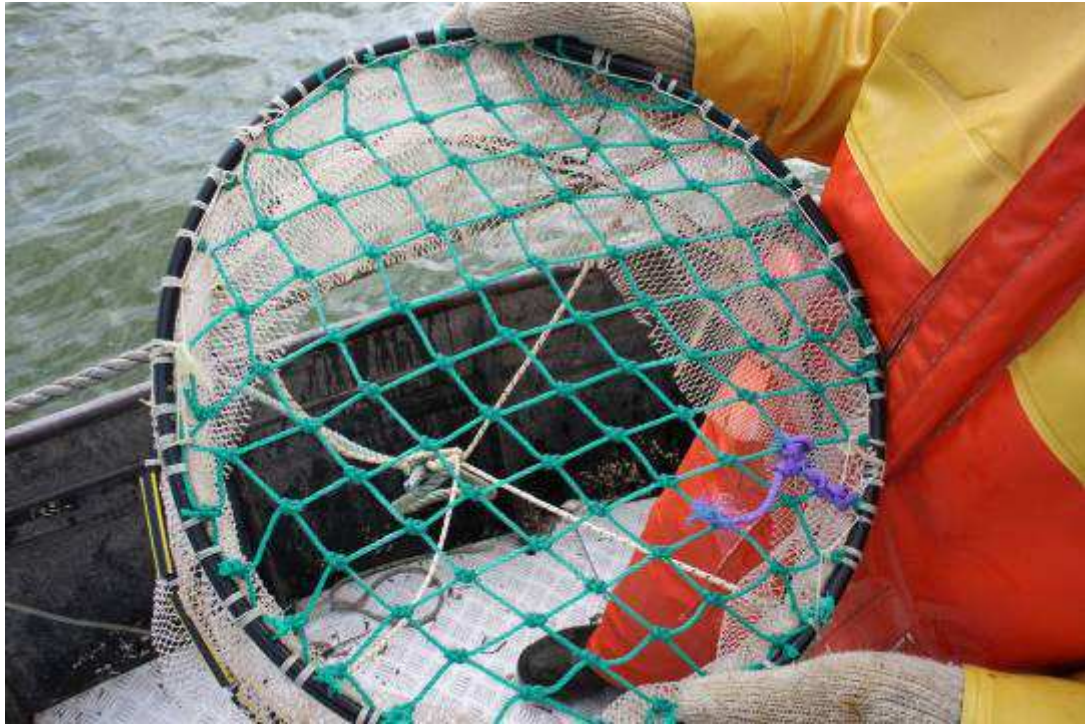
Ruif 75 mm gebruikt in hokfuiken IJsselmeer.