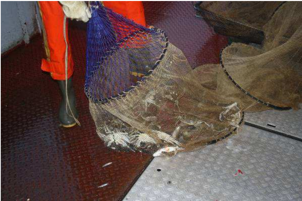
Met schietfuij verbonden "puntzak" van 60 mm mazen.