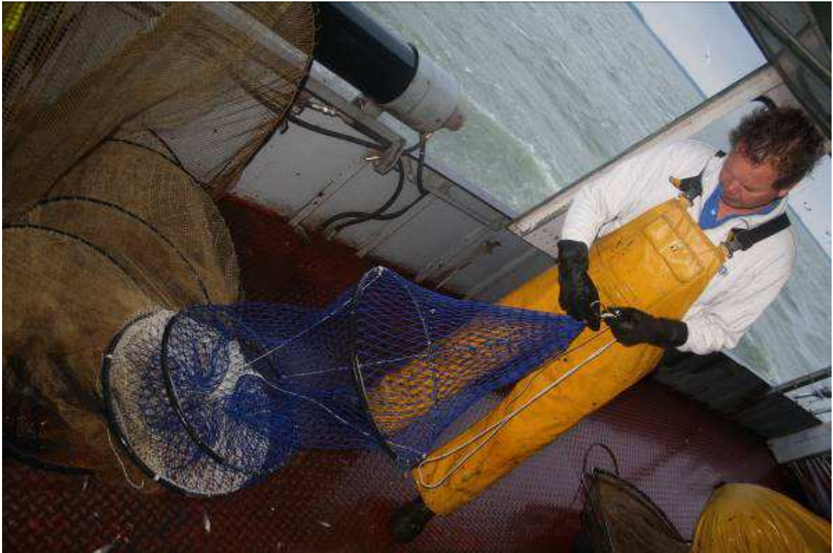
Geheel achterlijf met 60 mm mazen.