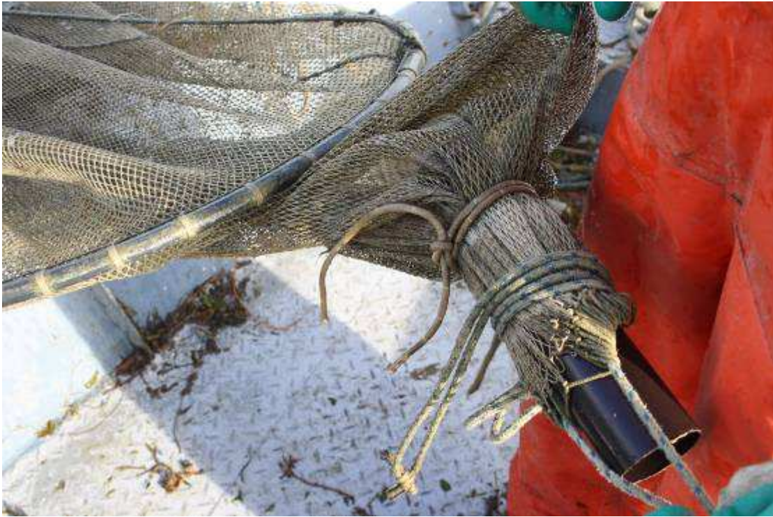
Bevestiging pijp aan hokfuik.