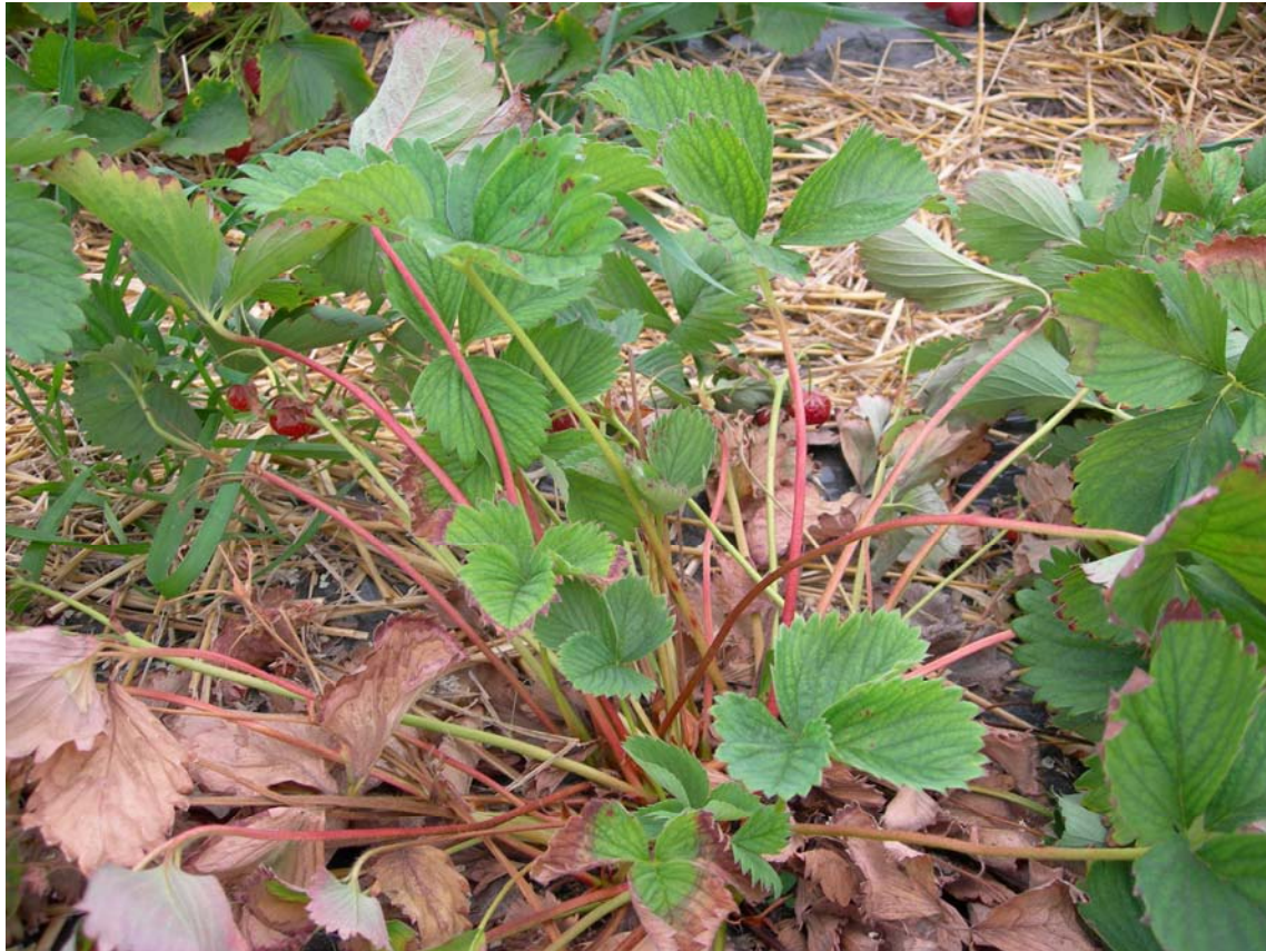
Figuur 4. Bovengronds symptoom op een aardbeiplant aangetast door Cylindrocarpon , zoals waargenomen in Nederland in 2006.