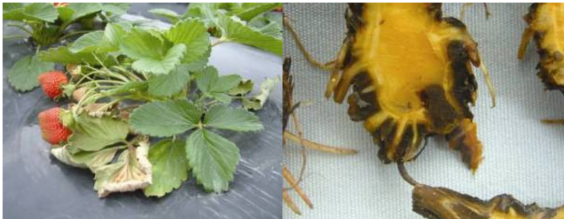
Figuur 3. Symptomen van Black Root Rot op het ras Karbala afkomstig uit Queensland. Links symptomen op het blad en rechts op de wortel. Uit het aangetaste weefsel werd Cylindrocarpon , Fusarium , Pythium en Rhizoctonia geïsoleerd (Hutton & Gomez, 2005).

Bovengronds leidt aantasting vaak tot een vorm van verwelking (Figuur 3A; Hutton & Gomez, 2005). En begint veelal met het verwelken van de hartbladeren. Nadien vergelen en verdorren ook de buitenste bladeren (Zinkernagel, 1970). Het buitenste weefsel van het rhizoom kan een zwartverkleuring geven (Figuur 3B; Hutton & Gomez, 2005).