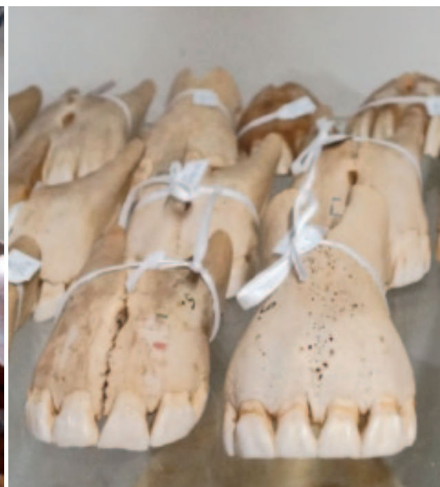
De agent van de verzekeringsmaatschappij ging met een koffer vol paardengebitten op pad; per levensjaar een gebit. Hierdoor kon hij nauwkeurig de leeftijd schatten van ieder paard.