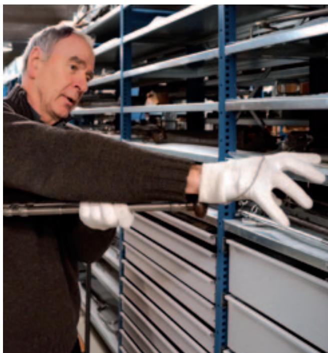
Werden dode ongeboren kalveren de laatste decennia vooral via de keizersnede gehaald, nu gebeurt dat weer vaker door foetotomie (afzagen'). Dat is voor de koe minder belastend. Dit instrument kan weer terug naar de praktijk.