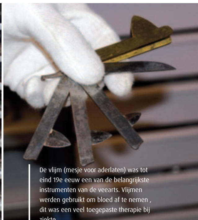
De vlijm (mesje voor aderen) was tot eind 19e eeuw een van de belangrijkste instrumenten van de veearts. Vlijmen werden gebruikt om bloed af te nemen, dit was een veel toegepaste therapie bij ziekte.