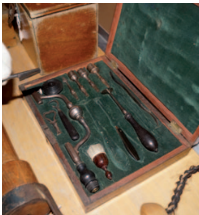
Deze trepaneerset stamt uit 1850 en was onmisbaar voor de behandeling van een voorhoofdsholteontsteking. Er werd een gaatje in de schedel geboord, zodat het ontstekingsvocht kon weglopen. In de schedel van het paard is het geboorde gat te zien.