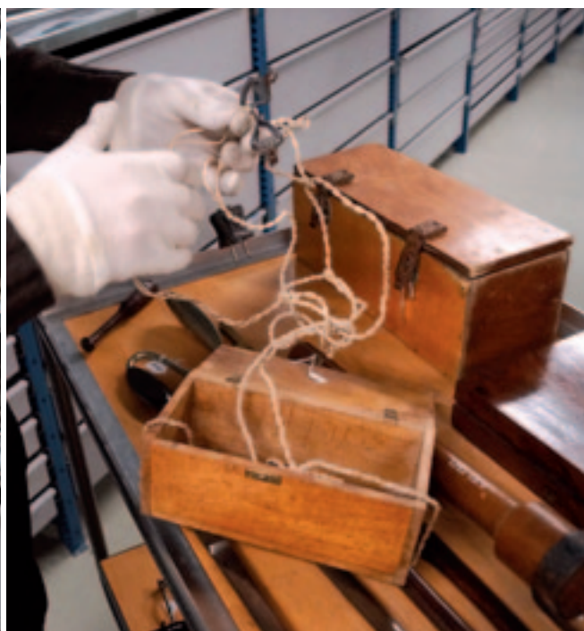
Dit euthanasieapparaat komt uit de jaren vijftig van de vorige eeuw. De elektrodes werden op de oortjes van de hond gezet en de stekker ging in het stopcontact. Voor kleine huisdieren was de stroomstoot meteen dodelijk.