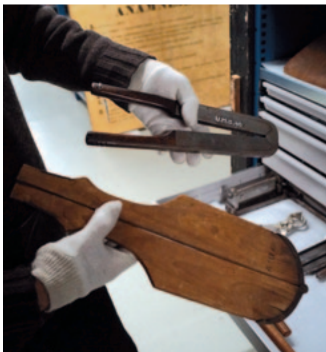
De houten castratieklem stamt uit 1780 en het andere exemplaar uit 1820. Met de klem werden de zaadstrengen afgekneeld waardoor het dier onvruchtbaar werd.

De valkuil van veel wetenschappelijke musea is dat zij de vooruitgang in de wetenschap willen laten zien. Koolmees: "Maar wij willen ook de mislukkingen laten zien. De wetenschap bestaat niet louter uit succesverhalen, maar met vallen en opstaan wordt vooruitgang geboekt. Een voorbeeld is de verlostang voor paarden en runderen in exact dezelfde uitvoering als de humane verlostang maar dan groter en zwaarder (zie foto). Bij dieren bleek die niet te werken omdat de voorpootjes als eerste geboren worden. Ten slotte distantieert Koolmees zich van museumbezoekers die bij het zien van de achttiende- en negentiende-eeuwse voorwerpen hun bedenkers als barbaars en dom bestempelen. "Dat is onjuist, de wetenschappers van toen waren niet dom, zij hadden evenveel herseninhoud als de mens van nu." Volgens Koolmees moet ieder voorwerp in zijn tijdgeest worden bekeken en moet de hedendaagse mens bescheidenheid aanleren ten opzichte van de eigen tijd. ⚡