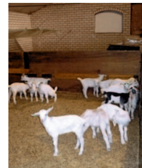
De lammeren van januari 2014.

Het jaar wordt opgeknipt in periodes van