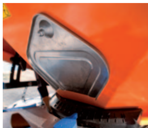
De driehoekige klep die toegang geeft tot het kleinste trechterdeel, biedt weinig werkruimte.