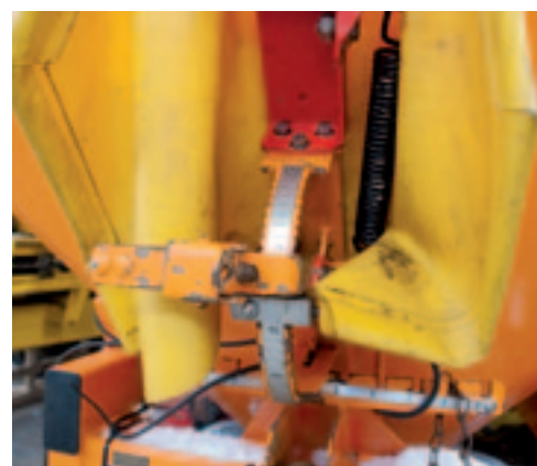
Voorgangers van de Axeo laten dosering en werkbreedte iets omslachtiger instellen.