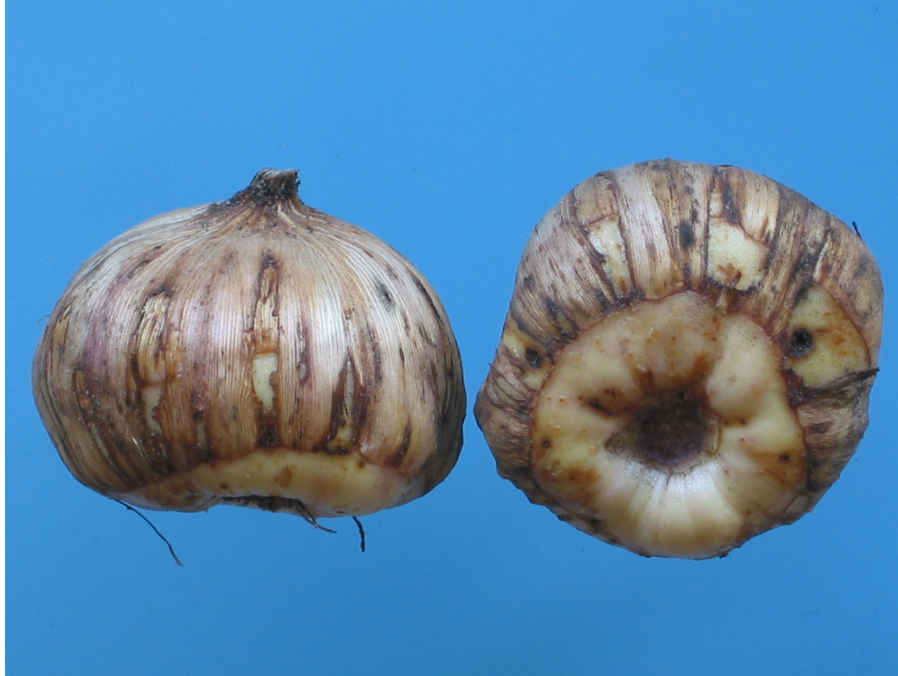
Foto 1: Vraatschade door bollenmijten aan de huiden van gladiolen