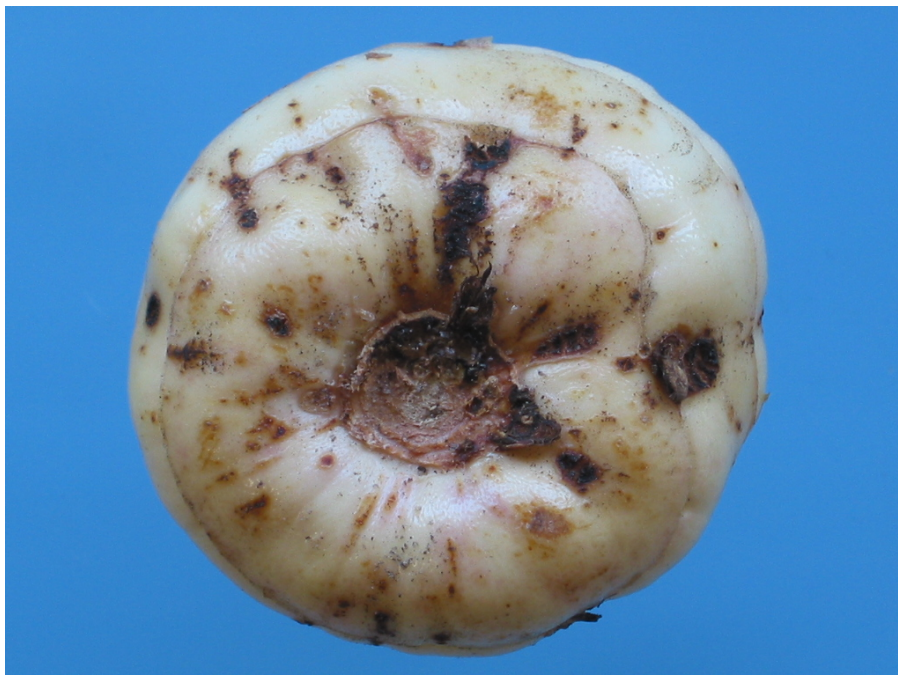
Foto 2: Vraatschade door bollenmijten aan het knolvlees van een gladiool