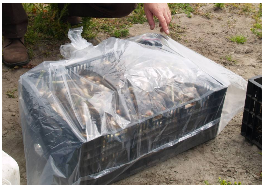
Foto 1. FreshStartbehandeling in een met plastic ingepakte krat tulpen direct na het rooien.

Door aanwezigheid van zuur op het moment van rooien kunnen voor de uitgevoerde proef geen conclusies worden getrokken voor de werking van FreshStart bij vroege toediening. Een tijdige toepassing van FreshStart is essentieel voor een goede werking. In dit geval was de toediening, ondanks het vroege moment, toch te laat.