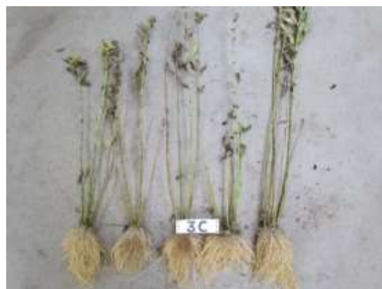
rechts: half substratvolume