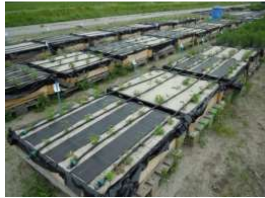
Foto 3.2. De kisten in juni 2012

Op 12 dec 2012 zijn alle bakken binnen gehaald en in een koelcel bij -1.5°C gezet. De stapels kisten zijn omhuld met plasticfolie.