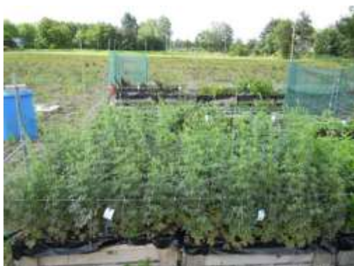
Foto 4.3.3.2. Delphinium, in mei naar buiten, foto augustus 2013