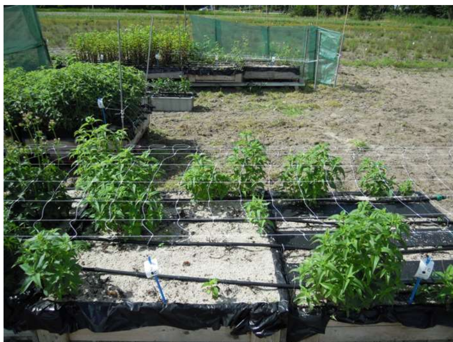
Foto 4.3.4.1. Monarda, in mei naar buiten, foto augustus 2013