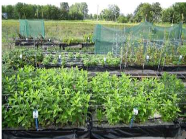
Foto 4.3.4.1. Phlox, in mei naar buiten, foto augustus 2013