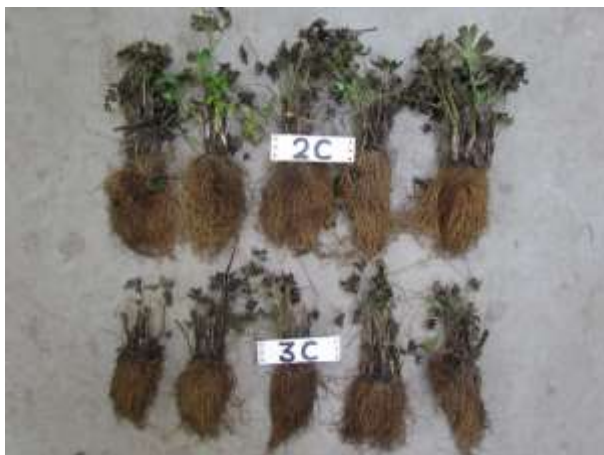
Foto 4.3.6.2. Delphinium, boven: volledig substratvolume onder half substratvolume