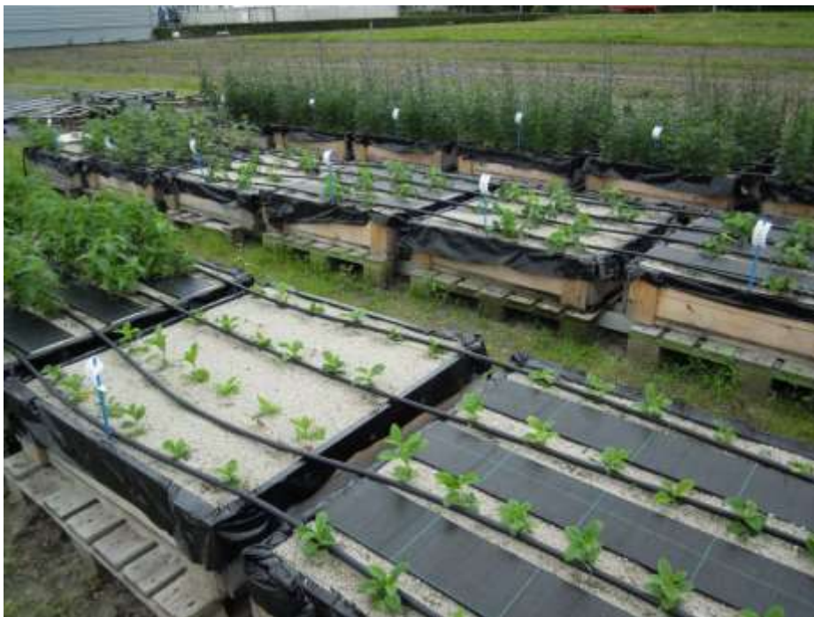
Foto 4.2.5.1. Phlox, juli 2012