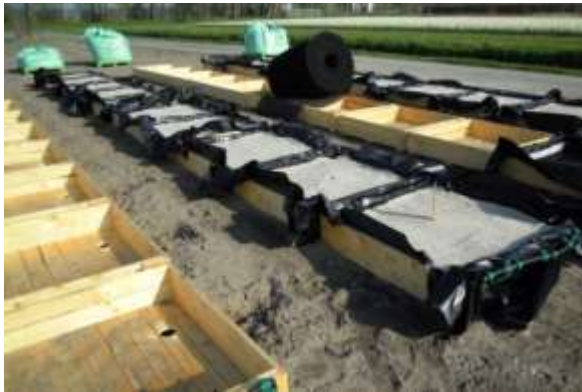
Foto 3.1. De kisten bij de aanleg in 2012

De methode van watergift (fertigatie) is aangepast door 4 slangen per bak te installeren, waarbij een slang langs elke rij planten lag.