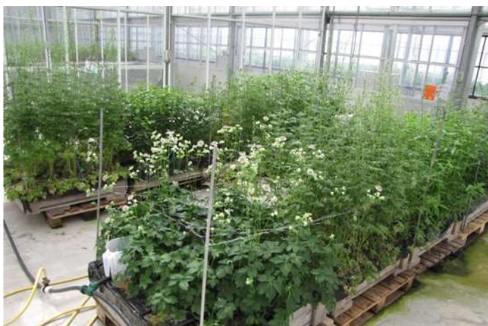
Foto 4.3.2.1. Vooraan Astrantia, in maart in de kas, foto half mei