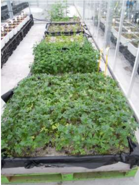
Foto 4.1.1. De gewassen in april 2012 in de kas.

De pilot met overgehouden kisten uit 2011 is succesvol verlopen. Alle gewassen groeiden in de kas en buiten goed weg.