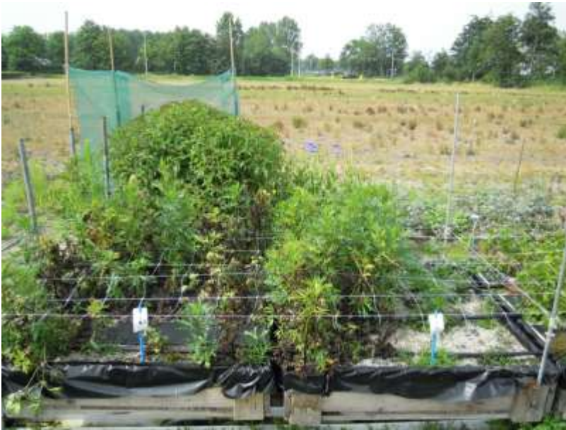
Foto 4.3.1.1. Aconitum, in mei naar buiten, foto juli 2013

De aantasting van de Aconitum door Fusarium leidde in dit tweede jaar tot veel te veel zieke planten. Daarom zijn er geen metingen aan de geogste takken gedaan. De gezonde takken hadden een goede kwaliteit.