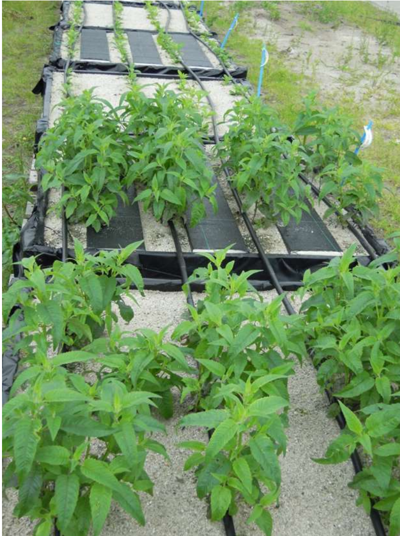
Foto 4.2.4.1. Monarda, juli 2012

De Monarda groeide goed weg, maar gaf in dit eerste jaar geen bloei.