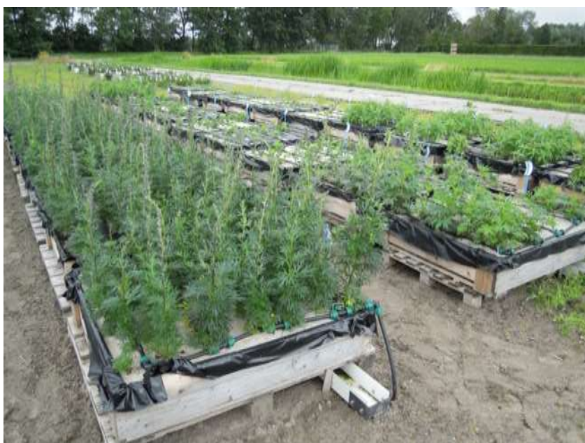
Foto 4.2.3.1. Delphinium, juli 2012