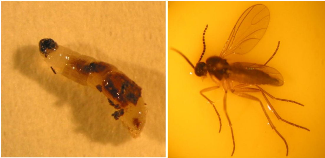
Figuur 1. Larve (links) en volwassen varenrouwmug (rechts) .

Varenrouwmuggen ( Sciara spp.) zijn donkergekleurd en 2 tot 3 mm lang en hebben antennes op de kop die lijken op een kralenketting. Aan het eind van de vleugel is een V-vorm in de adering te zien (figuur 1 rechts). De 3 tot 4 mm transparant witte pootloze maden hebben een zwarte kop (figuur 1 links) en bevinden zich op jonge levende plantendelen in de grond of op het grondoppervlak.