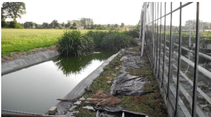
Figuur 3. Moerasfilter aangelegd bij een aardbeienteler.

Bij het gebruik van het moerasfilter als ontsmettingsmethode is het niet duidelijk welke micro-organismen in voldoende mate worden tegengehouden. Meer onderzoek is noodzakelijk voordat dit systeem kan worden aanbevolen voor gebruik in de praktijk. Zowel bij de aardbeienteelt op stellingen als in de boomteelt (containerteelt) zijn er telers die dit systeem naar alle tevredenheid toepassen. Het is een eenvoudige, goedkope, onderhoudsvriendelijke methode die relatief veel grondoppervlak vraagt.