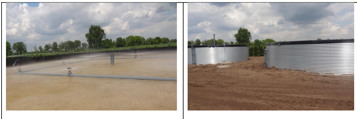
Figuur 1. Linksbovenkant van een langzaam zandfilter; rechts langzaam zandfilter met voorraadvat "vuil" drain water.