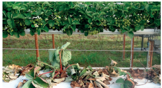
Foto 2. Op de voorgrond aardbeiplanten aangetast door Phytophthora (stelling 2, onbehandeld) en daarachter aardbeiplanten die één maal behandeld zijn met Paraat (stelling 3).