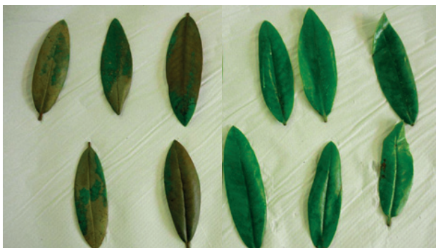
Foto 1. Links Rhododendron blaadjes aangetast door Phytophthora; afkomstig uit water vóór het langzame zandfilter. Rechts blaadjes vrij van Phytophthora, deze hingen in het water nadat het door het langzame zandfilter ging.

Met behulp van een eenvoudige biotoets met Rhododendron blaadjes kan de aanwezigheid van Phytophthora en Pythium in het water worden nagegaan. Worden deze blaadjes in een netje gestopt en enkele dagen in het water gehangen dan trekken ze zwemsporen van deze schimmels aan. Ze infecteren de blaadjes en vormen lesies (bruine vlekjes). Treedt er bruinverkleuring op van het blad (foto 1) dan is er een sterke indicatie dat er Phytophthora en/of Pythium sporen in het water aanwezig zijn. In een laboratorium worden de blaadjes op een selectieve voedingsbodem gelegd. De schimmels die hieruit groeien worden vervolgens geanalyseerd. Het resultaat geeft geen exacte aantallen weer maar een kwalitatieve aanduiding. Met deze methode kan Phytophthora al bij lage concentraties aangetoond worden.