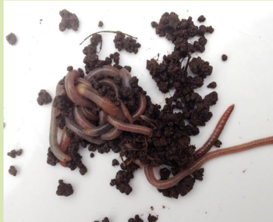
De meest voorkomende bodembewoner is Aporrectodea caliginosa