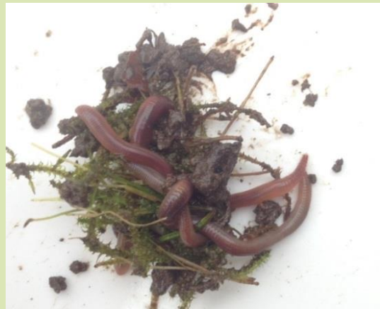
De meest voorkomende strooiselbewoner is Lumbricus rubellus .