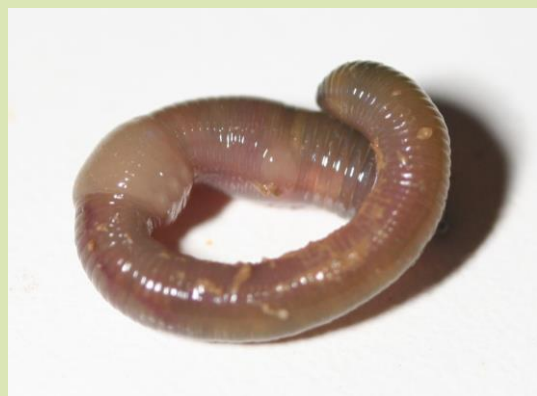
Een andere bodembewoner is Allolobophora chlorotica , herkenbaar aan een groenig, soms bijna fluorescerend, schijnsel.