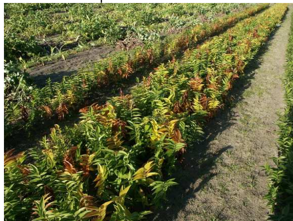
Foto 2. lelie in pot