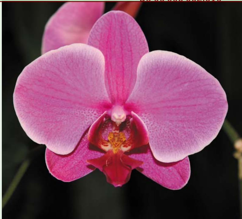
Orchidee Phalaenopsis; is case in dit project.