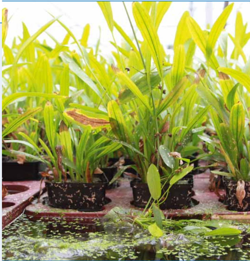
Drijvende planten behoren tot de specialiteiten van kwekerij Aqualook in Pijnacker, gespecialiseerd in tropische zoetwaterplanten.

nog steeds goed door met 20 tot 30 medewerkers. Ik denk dat we de resultaten van 2010 kunnen consolideren, hopelijk wordt het zelfs nog iets beter.”