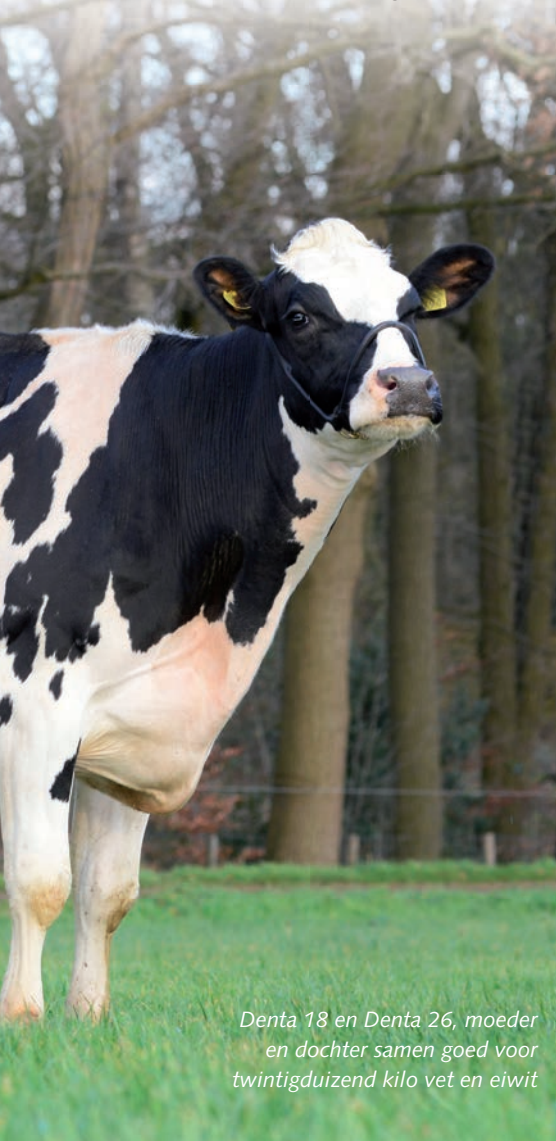
Denta 18 en Denta 26, moeder en dochter samen goed voor twintigduizend kilo vet en eiwit