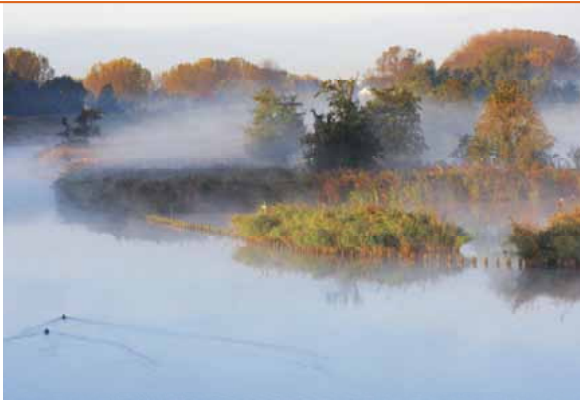
Het Natura 2000-gebied Zuider Lingedijk en Diefdijk Zuid is van belang vanwege ruigten en zomen, kalkmoerassen, vochtige alluviale bossen, bittervoorn, grote en kleine modderkruiper en kamsalamander.

als een probleem. Het frustreert allerlei projecten die ze willen uitvoeren en het wordt als lastig ervaren om met oplossingen te komen voor de gerezen problemen. Volgens veel politici draagt Natura 2000 bovendien bij aan de negatieve beeldvorming over politiek en beleid (Kooijmans, 2011; Lodewijks, 2011; Bots, 2010; Balkenende, 2009). Of zoals oud-gedeputeerd Jansen van Overijssel het verwoordt: “Het is jammer dat de regelgeving die bedoeld is vóór natuur er uiteindelijk toe leidt dat iedereen er een hekel aan krijgt” (Kobessen, 2011). Er is een continuïteit waarneembaar in de probleembeschrijvingen van de verschillende betrokkenen. De essentie is steeds hetzelfde en wordt ook steeds herhaald.