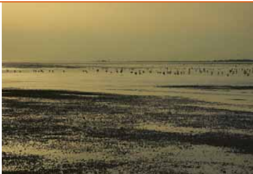
De Waddenzee zoals hier bij Ameland is als geheel (ruim 270.000 ha) aangewezen als Natura 2000-gebied.

zoals gebeurde tijdens het debat “Trots op Natura 2000 – Communiceren in crisistijd” (Neeffjes, 2010a; 2010b; Landwerk, 2010).