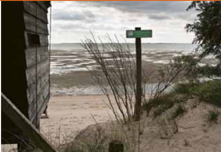
Natura 2000-gebied Voordelta met vogelkijk- hut De Bonte Piet

Op weinig andere plekken zal de frustratie over het beleid zo zichtbaar zijn geweest als bij de informatiebijeenkomsten die zijn georganiseerd. Het doel van die bijeenkomsten was om de mensen te informeren over het Natura 2000-beleid en om ze de mogelijkheid te geven om hun mening te geven. Bij alle vijf door ons bezochte avonden was de sfeer overwegend negatief. De onzekerheid over de gevolgen van Natura 2000 en de verbazing over de wijze waarop het beleid was opgesteld en uitgevoerd domineerden de discussie. De kritiek was niet alleen afkomstig van grondeigenaren en (agrarisch) ondernemers, maar ook van natuurbeschermers.