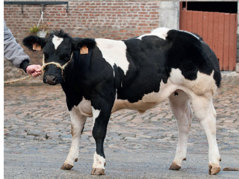
Rupture de Fooz in achter- en zijaanzicht met rechtsboven vader Langoureux de Fooz

groeien goed uit en bezorgen hun vader een combinatie-index gewicht-bespie- ring van 110 punten.