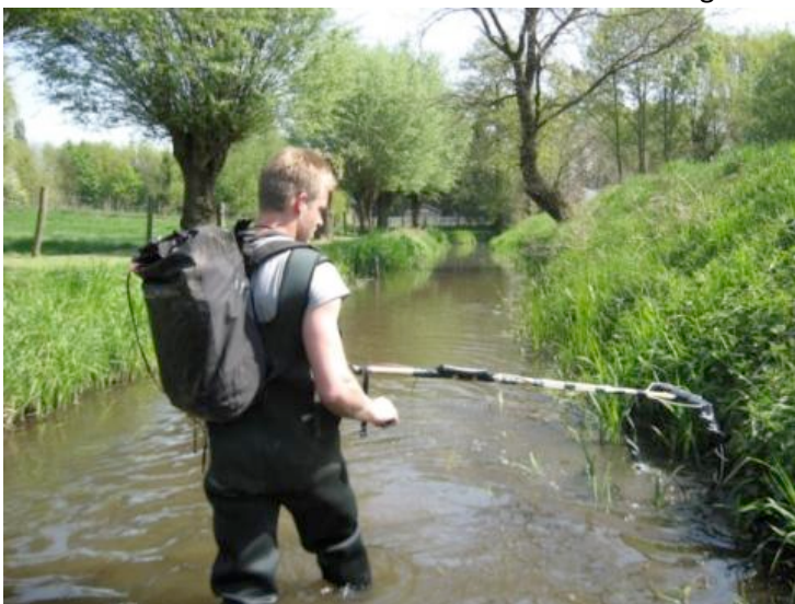
Afbeelding 4. Vismonitoring Itterbeek met het mobiele station

Het telemetriesysteem van OREGON-RFID is gebruikt om de passage van individuele vissen met een transponder (een geïmplanteerde zogenaamde PIT-tag) te registreren, zowel met een vast als met een mobiel detectiestation. Het vaste station is gebruikt om de intrek van vissen in de TMZ vast te stellen. De mobiele ontvanger is gebruikt om het ruimtelijke en temporele gedrag van vissen in het traject stroomafwaarts van de migratiezone in beeld te brengen (afbeelding 4). Het tweede type registratiesysteem is een zogenaamde fish counter , waarmee de stroomaf- en stroomopwaartse passage van vissen in de temporele migratiezone is bepaald. Zo kon het effect van de TMZ ook meer kwantitatief worden vastgesteld.