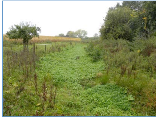
Afb. 3. De TMZ in haar doorstroommoeras-fase (oktober 2012)