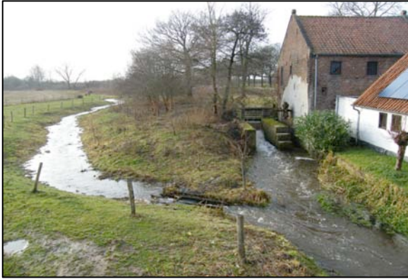
Afb.2: Hoogwater, december 2012, op de TMZ en bij de Schouwsmolen Wellicht draait hier ooit ook weer een waterrad.