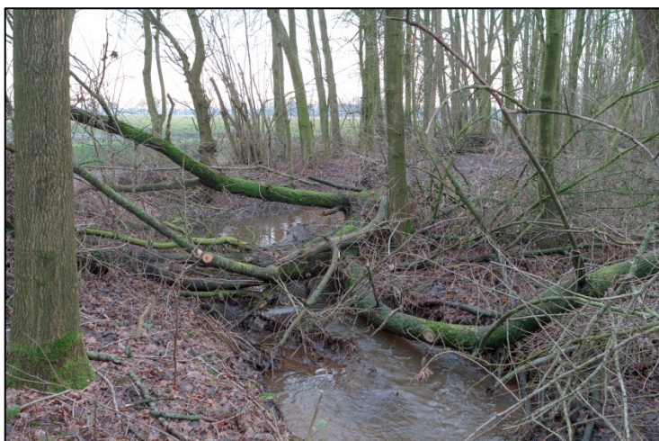
Afbeelding 6. Strijper Aa

Het TMZ concept lijkt hiermee ook bij te kunnen dragen aan de realisatie van de ecologische hoofdstructuur (EHS) en aan bepaalde Natura2000-doelen. Zo heeft Waterschap De Dommel eind 2012 een beboste TMZ gerealiseerd naast een grote stuw in de Strijper Aa. Dit alles in zeer korte tijd en tot volle tevredenheid van de betrokkenen in de streek (afbeelding 6). Kort na aanleg zijn ook in deze TMZ al de eerste beekvissen gevangen.