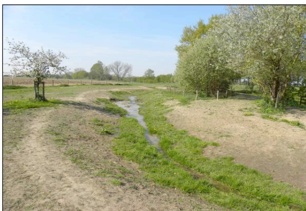
Afbeelding 1. Laagwater-impressie van de TMZ kort na aanleg (april 2011)

De gerealiseerde TMZ heeft een lengte van 80 m en overbrugt daarbij een verval circa 80 cm (afbeelding 1).