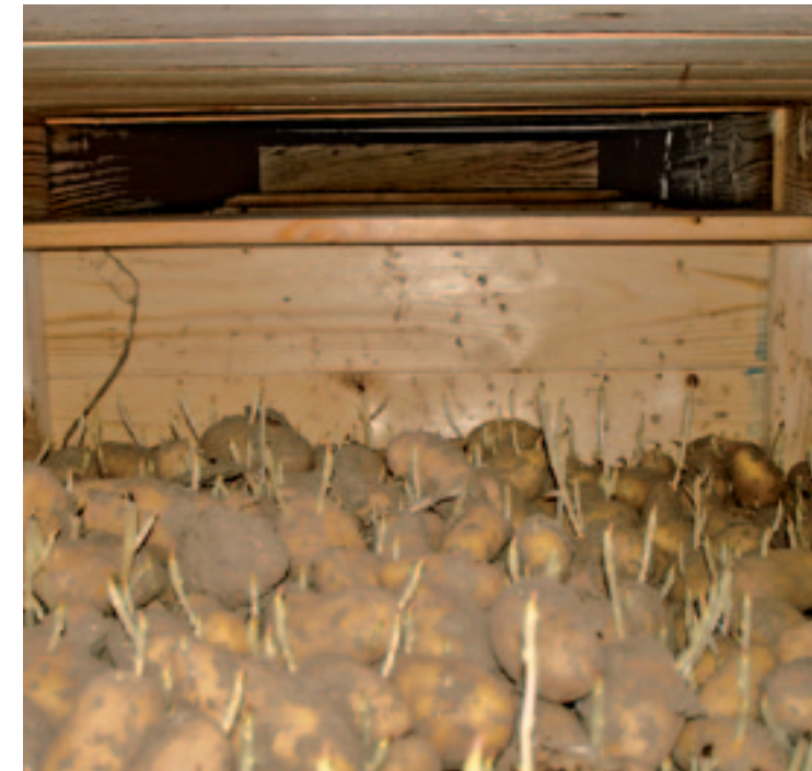
▲ Als de kiemrust voorbij is, is er eerst sprake van een topspruitdominantie.

Ook tijdens de bewaring van aardappelen wordt de kiemrust nauwelijks beïnvloed door de bewaartemperatuur. Alleen bij een extreem hoge of lage temperatuur verandert deze. Denk daarbij aan een knoltemperatuur van boven 25 tot 30 graden Celsius of bij