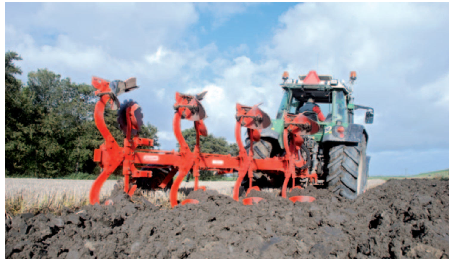
Het gemonteerde rister voor zavelgrond keert de poldergrond prima. Opvallend is wel dat het rister de grond erg verkruijmt. Op lichtere gronden ontstaat daardoor het risico op verslemping.

Maschio levert drie typen risters: een strokenrister voor kleirijke gronden, een rister voor zavelgronden en de één voor lichte en zandrijke gronden. Onze Sisto 4 is uitgevoerd met het risterstype voor zavelgronden en op het oog ziet dat er netjes uit. De schaarpunt kun je omdraaien en per schaar is de breedte instelbaar van 30 tot 50 cm. Het rister keert de bonte poldergrond in de Wieringermeer prima. Opvallend is wel dat het rister de grond erg verkruijmt.