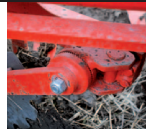
De diepte van het schijfkouter. Een prima fijnstelling, maar voor één persoon niet heel makkelijk uitvoerbaar.