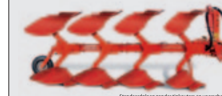
Standaardploeg zonder tipkouters en voorscharen