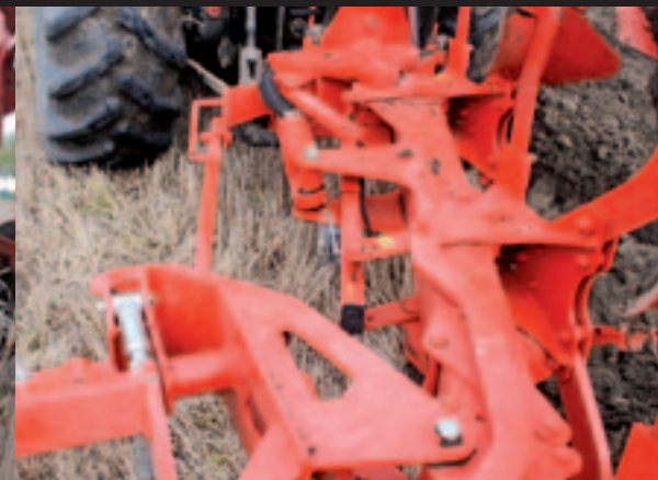
Het frame, met een hoofdbalk van 150 x 150 mm is degelijk, de variabele verstelling ziet er netjes uit.