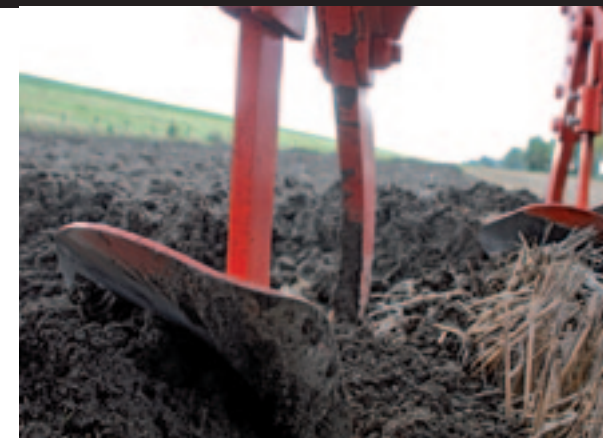
De tipkouters en voorscharen doen het op de tarwestoppel en zwarte grond goed. Met een groenbemester is een schijfkouter beter.