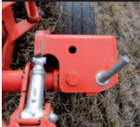
Het tastwiel is te verstellen. Een extra moer voorkomt dat de aanslag verloopt. Het dieptewiel draait tijdens het wentelen altijd goed.