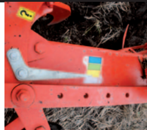
De breedte is af te lezen met een wijzer. De maat is niet metrisch. Dat is lastig.