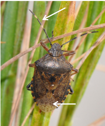
Foto 3: grauwe veldwants. De pijlen duiden op de belangrijkste verschillen met de bruingemarmeerde stinkwants ( Halyomorpha halys ). Het vierde (dus voorlaatste) segment van de antennes van de grauwe veldwants is zwart, bij H. halys is dit wit (let op kleurschakeringen vallen niet samen met de 'knikken' tussen de verschillende segmenten: op deze foto heeft het vijfde segment zowel een zwarte (uiteinde) als witte band, en daarna de 'knik' met het vierde segment dat dus zwart is). Op het membraan t.h.v. het achterlijf heeft de veldwants zwarte stippen, terwijl H. halys hier langwerpige ovale zwarte vlekken vertoont.

Tot op heden werd aangenomen dat een heteroogeen complex van diverse boswantsensoorten verantwoordelijk is voor de aangestoken, misvormde vruchten in de biologische perenteelt. De grote waarde van dit eerste jaar van veldonderzoek is dat we verschillende indicaties bekomen hebben dat het probleem terug te brengen is tot één soort die de schade veroorzaakt: de roodpootschildwants ( Pentatoma rufipes ). We kunnen ons echter enkel baseren op basis van de waarnemingen van slechts één seizoen. Dit dient dus nog bevestigd te worden in opvolgwerk komend seizoen, waarbij we ook enkele gerichte bestrijdingsstrategieën in proef zullen leggen.