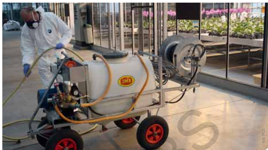
▲ Om een fytolicensie op basis van ervaring te krijgen, zal je moeten bewijzen dat je over de nodige kennis beschikt.

Om een fytolicensie te krijgen, zal je moeten bewijzen dat je over de nodige kennis beschikt. Wie land- of tuinbouwonderwijs gevolgd heeft, zal – afhanke-