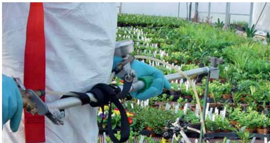
▲ Per bedrijf kan je maximaal vier fytolicensies van niveau 2 aanvragen.

professionele activiteiten invullen. Voor de land- en tuinbouw zijn de mogelijke hoofdactiviteiten: landbouw, tuinbouw, loonwerk of tuinaanleg en/of -onderhoud. De keuze van de hoofdactiviteit heeft geen gevolg voor de geldigheid van je fytolicensie. Geef je dus landbouw op als hoofdactiviteit, dan is je fytolicensie ook geldig op een tuinbouwbedrijf. Als jouw activiteiten niet gebonden zijn aan een bedrijf of als je geen bedrijf hebt, dan hoef je deze rubriek niet in te vullen. Diegenen die verantwoordelijk zijn voor een fytolokaal, moeten dit wel invullen. Wie een fytolicensie wil aanvragen voor één of meerdere werknemers, moet ook de professionele activiteiten van zijn bedrijf invullen.