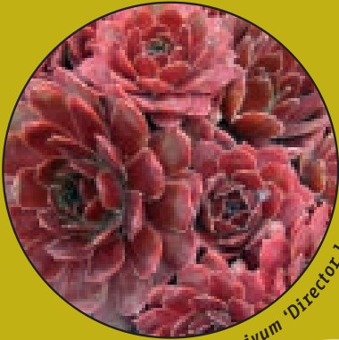
Sempervivum 'Director Jacobs'

In Roelofarendsveen ligt op het terrein van Naktuinbouw de 'Moederplantentuin' voor vaste planten. Deze sortimentstuin, bestaande uit rasechte vaste planten, dient als referentiekader voor het vaste plantenvak in Nederland. De meest verhandelde vaste planten, circa 3.000 rassen, staan hier op één plek bij elkaar. Een unieke verzameling dus.