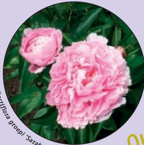
Paeonia (lactiflora groep) 'Sarah Bernhardt'