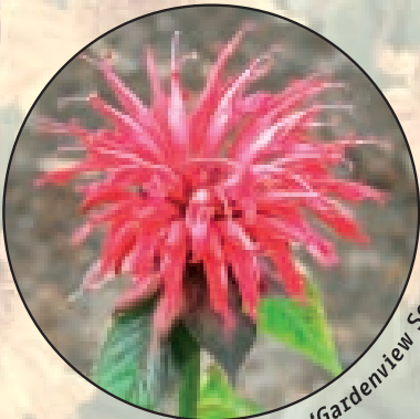
Monarda 'Gardenview Scarter'

In Roelofarendsveen ligt op het terrein van Naktuinbouw de 'Moederplantentuin' voor vaste planten. Deze sortimentstuin, bestaande uit rasechte vaste planten, dient als referentiekader voor het vaste plantenvak in Nederland. De meest verhandelde vaste planten, circa 3.000 rassen, staan hier op één plek bij elkaar. Een unieke verzameling dus.