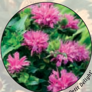
Monarda 'Petit Delight'

Vanuit de wetgeving moeten vaste planten rasecht verhandeld worden. Daarnaast wil de koper van vaste planten ook de zekerheid hebben dat hij krijgt waarom hij gevraagd heeft. Naktuinbouw, kwekers en handelaren van vaste planten hechten daarom grote waarde aan goed geïdentificeerd plantmateriaal. In Nederland is formeel geen enkele organisatie verantwoordelijk voor deze identificatie. Dit moeten de kwekers zelf doen.