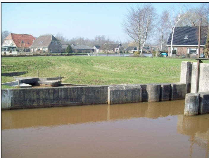
Afbeelding 1: IJzerrijke sloot bij gemaal Wetering.

In dit onderzoek was de belangrijkste vraag van waterschap Reest en Wieden of de binding van fosfaat door ijzerrijk slib in sloten voldoende is, en of deze binding geoptimaliseerd kan worden door opwervelen, al dan niet in combinatie met beluchten. De verwachting was dat fosfaat effectiever zou binden aan ijzer onder invloed van zowel opwervelen als beluchten.