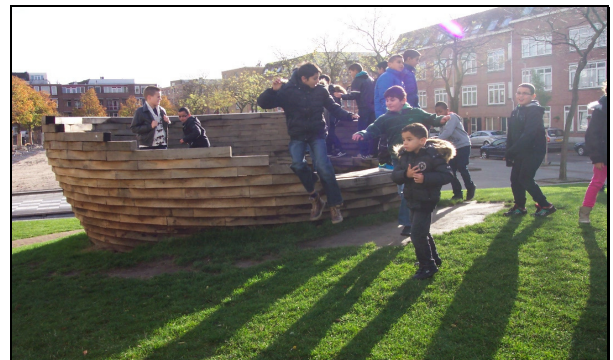
Afbeelding 4: Schoolplein Hildegardisschool

Elze Hemke – Ministerie van Economische Zaken – Directie Natuur en Biodiversiteit