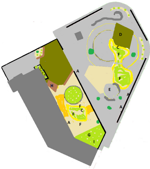
Afbeelding 3: Groene herinrichting Nicolaasschool

De uitkomsten van dit project kunnen gezien worden als een (voorzichtige) ondersteuning voor de veronderstelling dat groene schoolpleinen bijdragen aan de kwaliteit van leven van schoolkinderen. Hoewel aanvullend onderzoek gewenst is biedt dit wel ruggesteun voor het beleid om deze groene schoolpleinen te stimuleren. De aanbeveling is om dit stimuleringsbeleid voort te zetten.