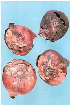
Foto 1: Stengelaaltjes bij tulp; gemakkelijk te verwarren met zuur

Eerst is onderzocht wat er gebeurt met tulpenbollen, aangetast door stengelaaltjes, ondergedompeld in gewoon leidingwater. Uit aangestaste tulpenbollen bleken in water al na korte tijd stengelaaltjes vrij te komen. De aantallen per de tijd waarin dat gebode verscheidde per bol. Na enkele minuten waren dit dertallen, na 15 minuten bodanden na vier duizenden tot tienduizenden per bol. Overigens bleek wel weer dat het erg moeilijk is om aan de hand van bobsymptomen een stengelaaltjesaan-